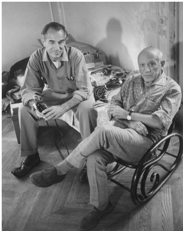
Дункан и Пикассо

Весь следующий год Дункан проведет вместе с художником, без ограничений фотографируя его самого, семью и, конечно, картины. Результатом такого необычного эксперимента станет вышедшая в 1958 году книга «Личная жизнь Пабло Пикассо. Фотографии величайшего художника», изданная Harper & Brothers. Мир впервые увидел Пикассо в его естественной среде – за работой в ателье.