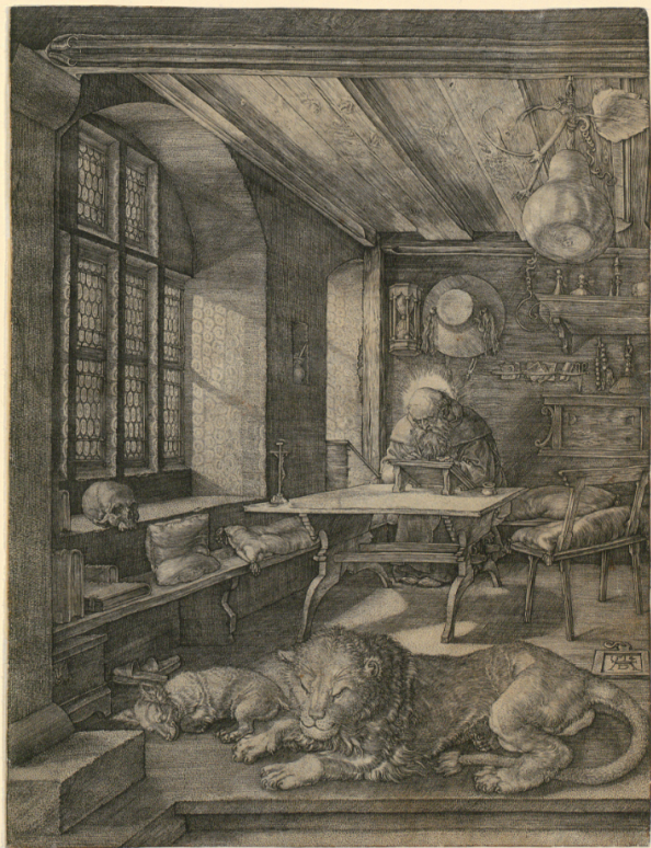
Святой Иероним в келье. Альбрехт Дюрер. 1514

Выставка открывается гравюрой Дюрера 1514 года, на которой изображен святой Иероним, сидящий в келье у окна за письменным столом. Картина не случайно выбрана в качестве отправной точки всей экспозиции: здесь присутствует большинство традиционных для подобных сюжетов символов, значение которых интуитивно понятно зрителю. Вполне традиционно свет, озаряющий труд святого, падает с правой от него стороны. Композиционно картина построена таким образом, что зрителю кажется, будто он сам входит в келью, становясь частью интимного пространства. Окно, сквозь которое лучи солнца падают на листы бумаги, которыми занят главный персонаж, приобретает еще один возможный смысл: святой Иероним считается автором перевода Библии на латынь, так называемой Вульгаты, ставшей впоследствии официальным переводом Священного писания. И потому символизм картины предполагает, что руку и мысль Иеронима ведет божественная сила.