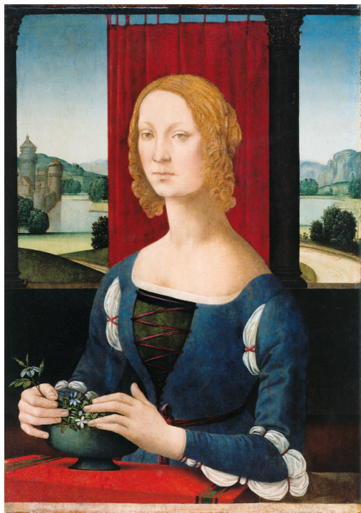
Портрет Катерины Сфорца. Лоренцо ди Креди. 1485-1490

Постепенно смысловой потенциал окон претерпевал изменения. Чтобы легче было о них говорить, перескочим сразу через несколько веков. Если до импрессионизма окно вело зрителя во внешний мир из замкнутого пространства дома или приглашало заглянуть в комнату снаружи, то во второй половине 19 века художники намеренно размывают эти границы. Матисс, Боннар, Моне - каждый в свойственной ему манере использовал похожий прием. Фигуры людей уже не несут религиозных смыслов. Больше внимания уделяется психологической характеристике момента.