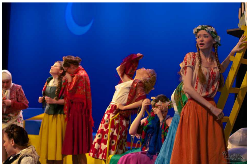
Сцена из спектакля "Бабий бунт"

Открытие фестиваля состоялось 26 апреля на сцене театра Cité Bleu. Главным событием вечера стало выступление выпускников Театрального института им. Б.В. Шукина, которые привезли в Женеву один из своих спектаклей – «Бабий бунт», построенный по мотивам рассказов Шолохова. Несмотря на свой молодой возраст (выступление в Женеве стало 23-м), спектакль с успехом идет в Москве.