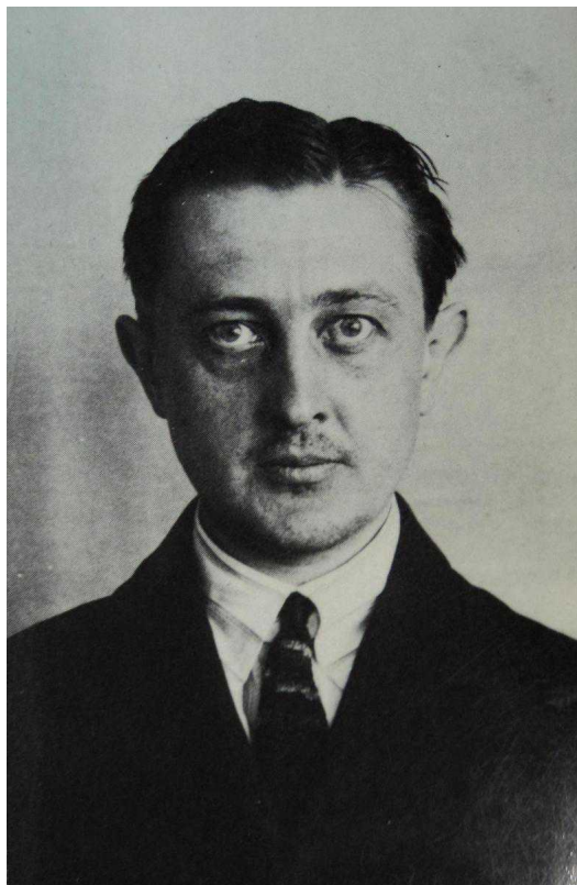
А.П.Полунин. Из книги А.Gattiker. L'affaire Conradi. Berne-Francfort/M., 1975.