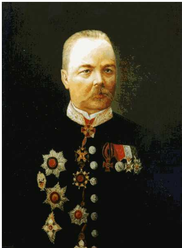
Николай Александрович Скрябин