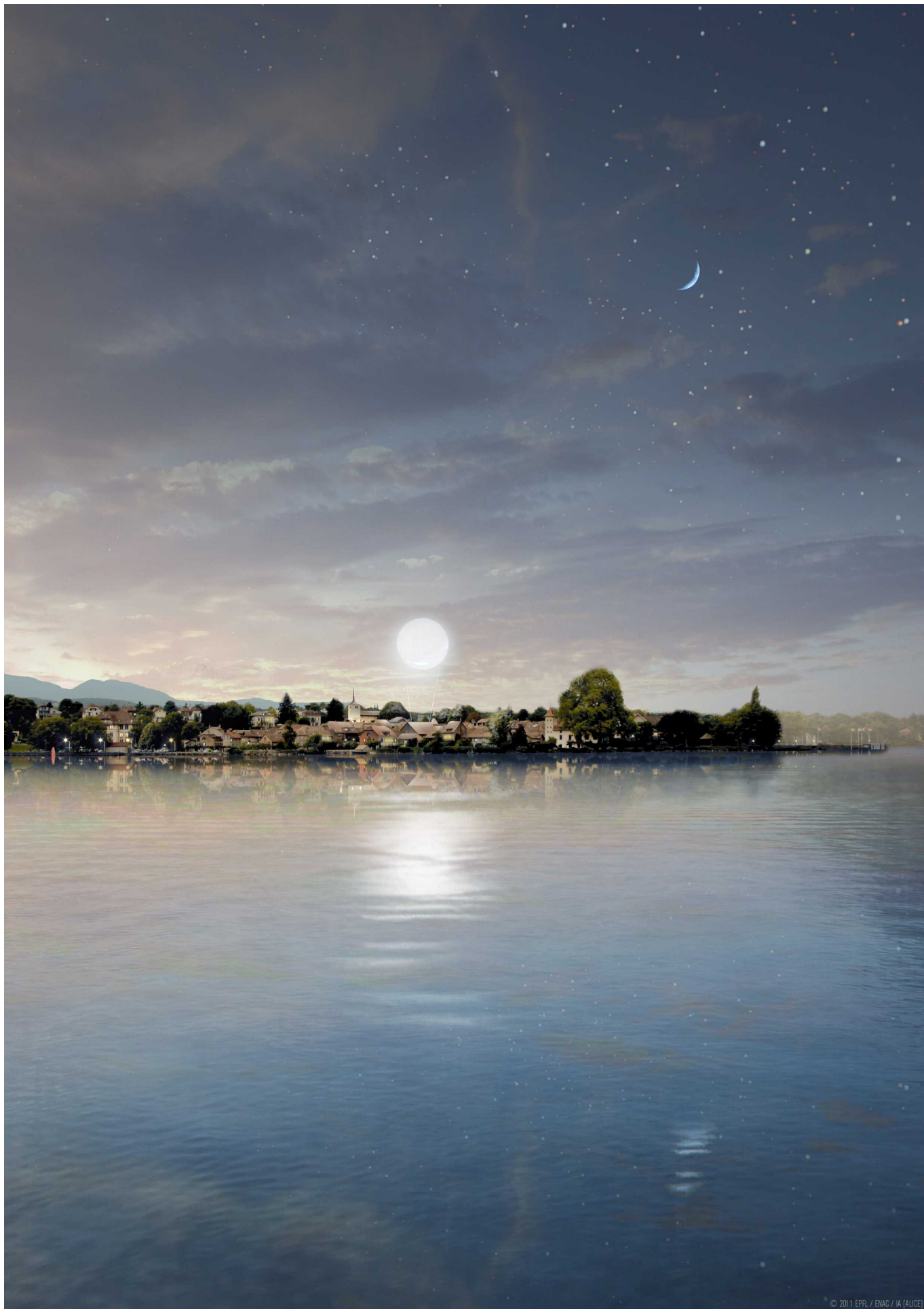
Серебристый шар над городком Сен-Пре будет виден с озера Эффектная полусфера, спроектированная дизайнерами Федеральной