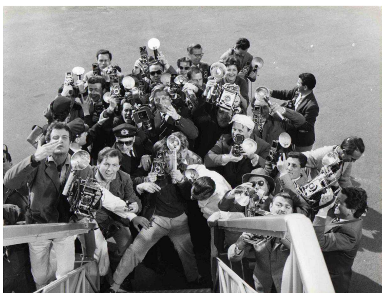
Папарацци встречают Аниту Экберг в "Сладкой жизни", 1960