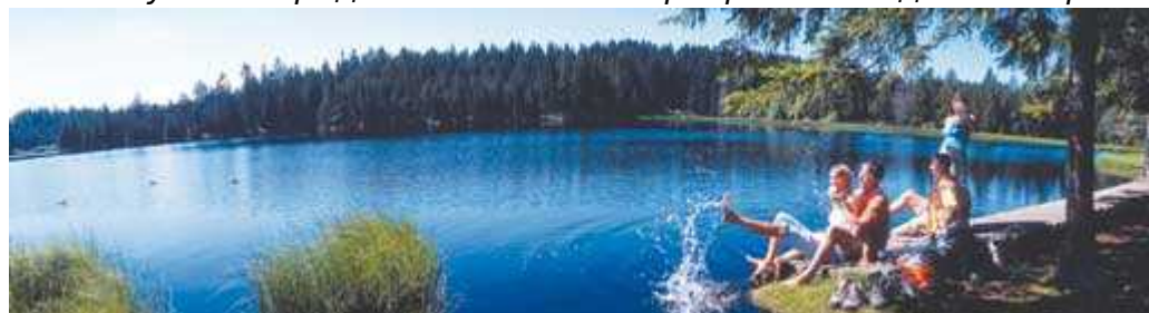
Озеро Грюйер ( www.ch.ch ) кантон Юра

Из истории известно, что в здешних краях в XV веке проживала графиня де Монфокон-Монбельяр, хозяйка замка Этобон (современная территория французского департамента Верхняя Сона). Звали ее Генриетта или, по народному обычаю, – Ариетта. За свою доброту и благотворительность графиня настолько полюбилась простому люду, что про нее стали слагать легенды. С годами предание обрастало все новыми чудесными эпизодами, так что несколько веков спустя графиня Генриетта стала в устах народных сказителей прекрасной подземной феей Арией.