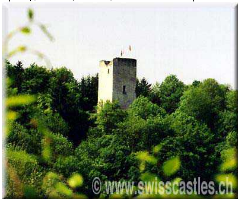
Миландрская башня в кантоне Юра

прийти сюда через год в такую же волшебную майскую ночь, и при лунном свете соберешь все сокровища, расстеленные на траве вокруг башни. А в ожидании чуда приходи почаще навещать меня в этом гроте.