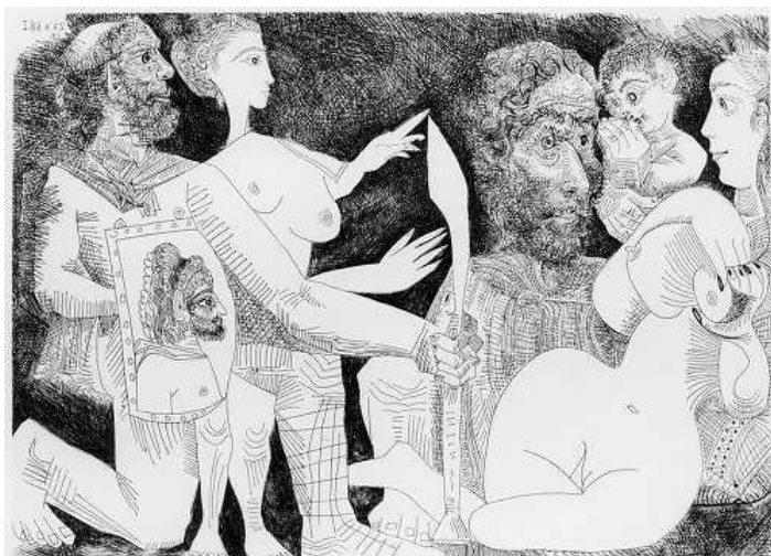
Пабло Пикассо, офорт 1968 года

100 гравюр, созданных с 1905 по 1971 годы, независимо от стилистических и философских исканий Пикассо в разные периоды жизни и творчества, объединены одной темой: желаемого и желавшего женского тела. Сексуальность становится центром притяжения в художественном универсуме мэтра, приобретая гротескные, чувственные, откровенные или символические формы.