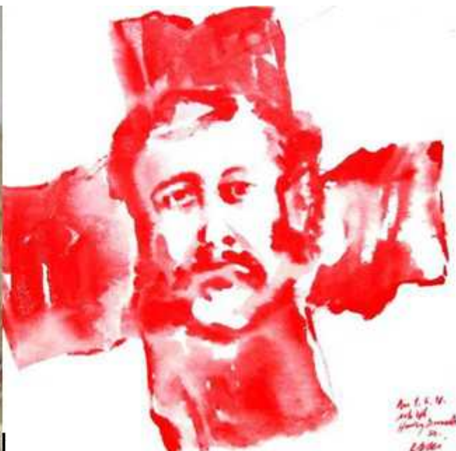
Красный крест с портретом Анри Дюнана кисти Ханса Эрни

От Далай-Ламы до членов правительства: в честь Анри Дюнана знаменитые швейцарцы и иностранцы создали изображения красного креста - символа международной гуманитарной организации и самой Конфедерации. Эти картины можно купить на интернет-аукционе.