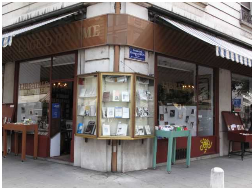
Книжный магазин в Женеве

Что Вы думаете о входящих в моду электронных книгах, знаменитых E-books?