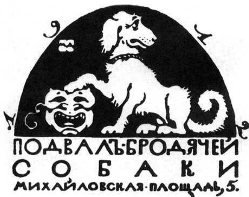
Эмблема работы М. Добужинского, 1912 год

себя на родине известен, практически, только музыковедам (положение обязывает) или филологам (в связи с Ахматовой)? Попробуем разобраться.