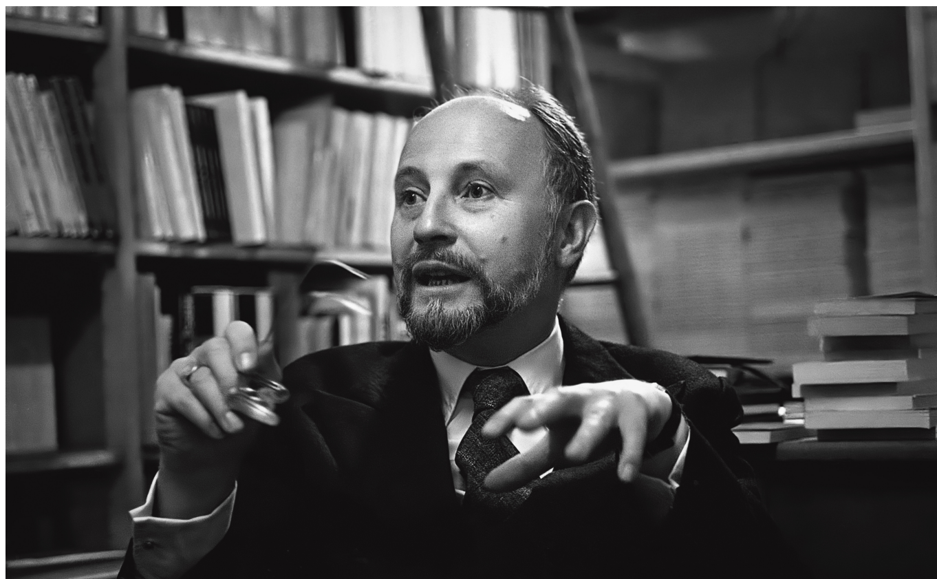
Vladimir Volkoff, 1979, Lausanne

Ainsi tient en un seul paragraphe une vie romanesque que se disputent Russes, Américains et Suisses. Sur les six photographies qui lui sont consacrées, il apparaît tantôt totalement absorbé par l'écriture (toujours debout !), tantôt souriant et détendu.