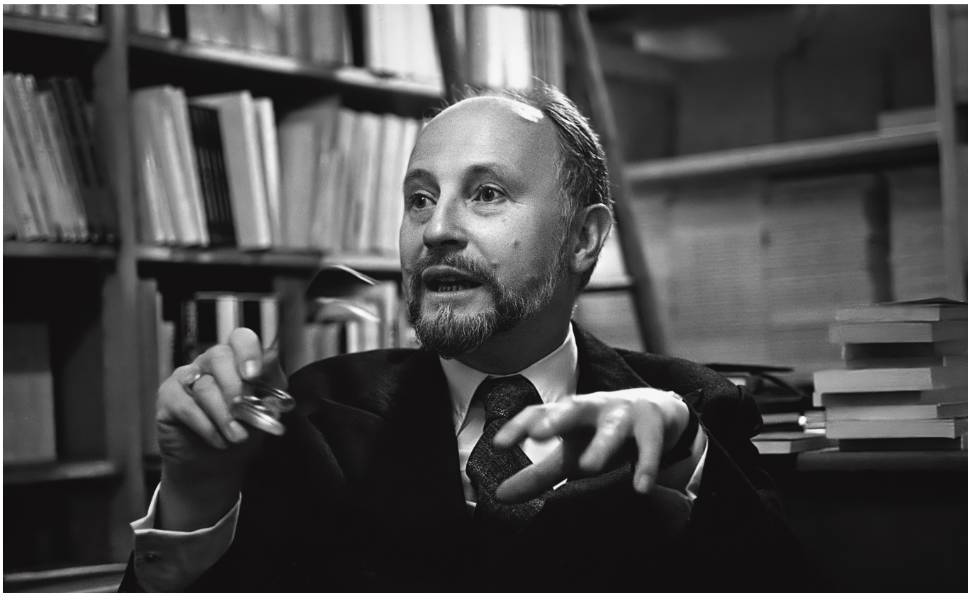
Владимир Волкофф, 1979 г., Лозанна

«Русский, американец, 1899-1977. Владимир Набоков бежал от большевистской революции, найдя сначала убежище в Великобритании, затем в Германии и в Соединённых Штатах. Он писал свои рассказы и романы по-русски, а позже – по-английски. Публикация во Франции его знаменитой «Лолиты» (Olympia Press, 1955) вызвала множество скандалов, после чего книга обрела мировую славу. С 1961 года и до самой смерти в 1977-м Владимир Набоков жил в фешенебельном отеле в Монтрё». Так, в один параграф уместилась достойная романа жизнь знаменитого писателя, «права» на которого оспаривают между собой русские, американцы и швейцарцы. На шести его фотографиях, включенных в книгу, он запечатлен в разных настроениях: полная сосредоточенность в процессе письма (стоя!) на одной и расслабленная улыбка на другой.