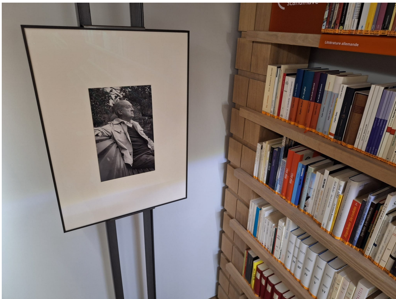
Фрагмент выставки в Фонде Яна Михальского в Монтрише

Автор: Надежда Сикорская, Лозанна , 24.12.2025.