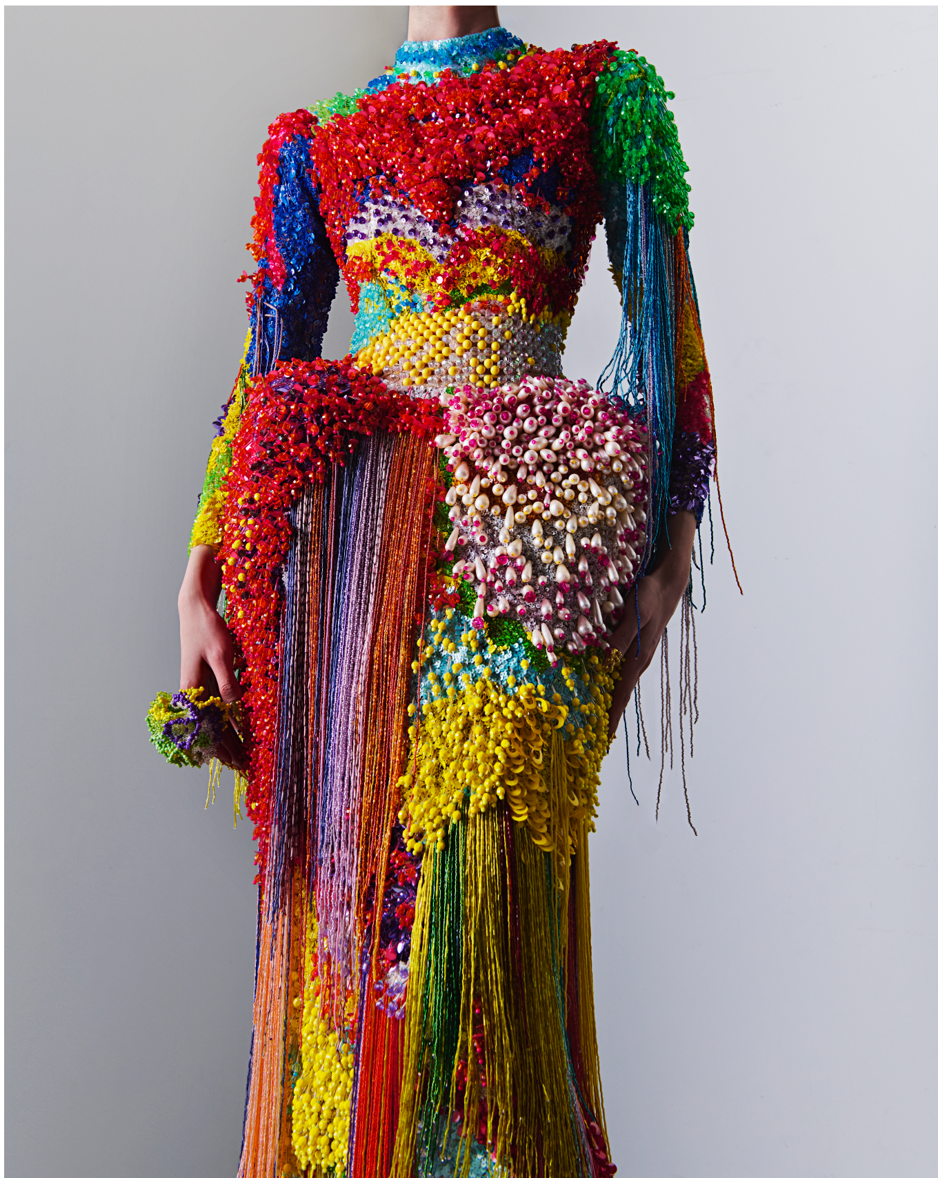
Germanier, Haute Couture, SS25, Les Globuleuses, 2025 © Alexandre Haefeli

Один из самых интересных экспонатов – плакат для 60-го Джазового фестиваля в Монтре, над дизайном которого работал Жерманье. На изготовление панно из 60 000 бусин и пайеток, вышитых на черном фоне, у шести человек ушло две недели непрерывной работы. Вообще Жерманье очень любит различные коллаборации. В тудас можно увидеть, среди прочего, платье, сшитое из старых ручек и карандашей