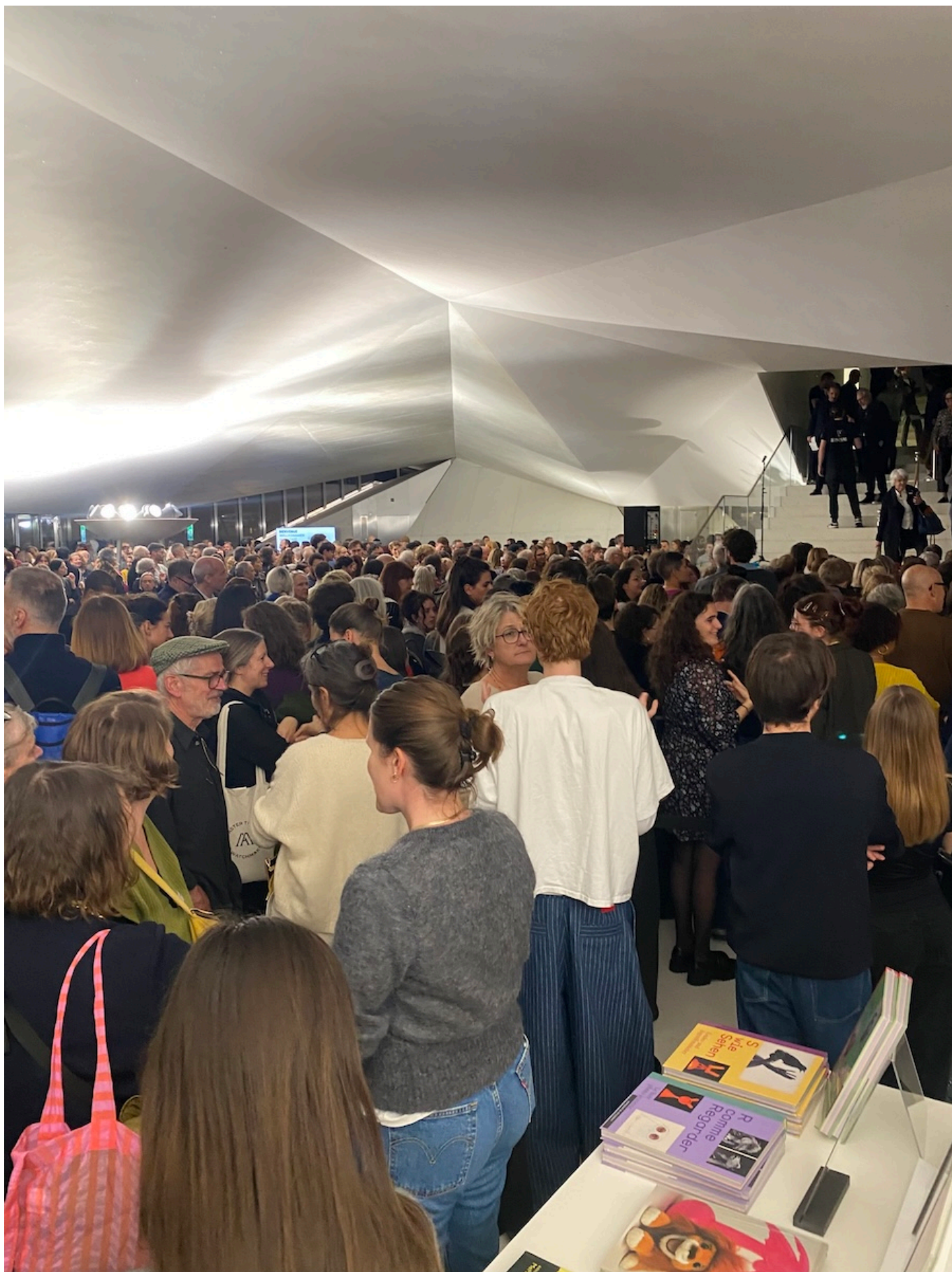
На вернисаж пришло огромное количество людей.