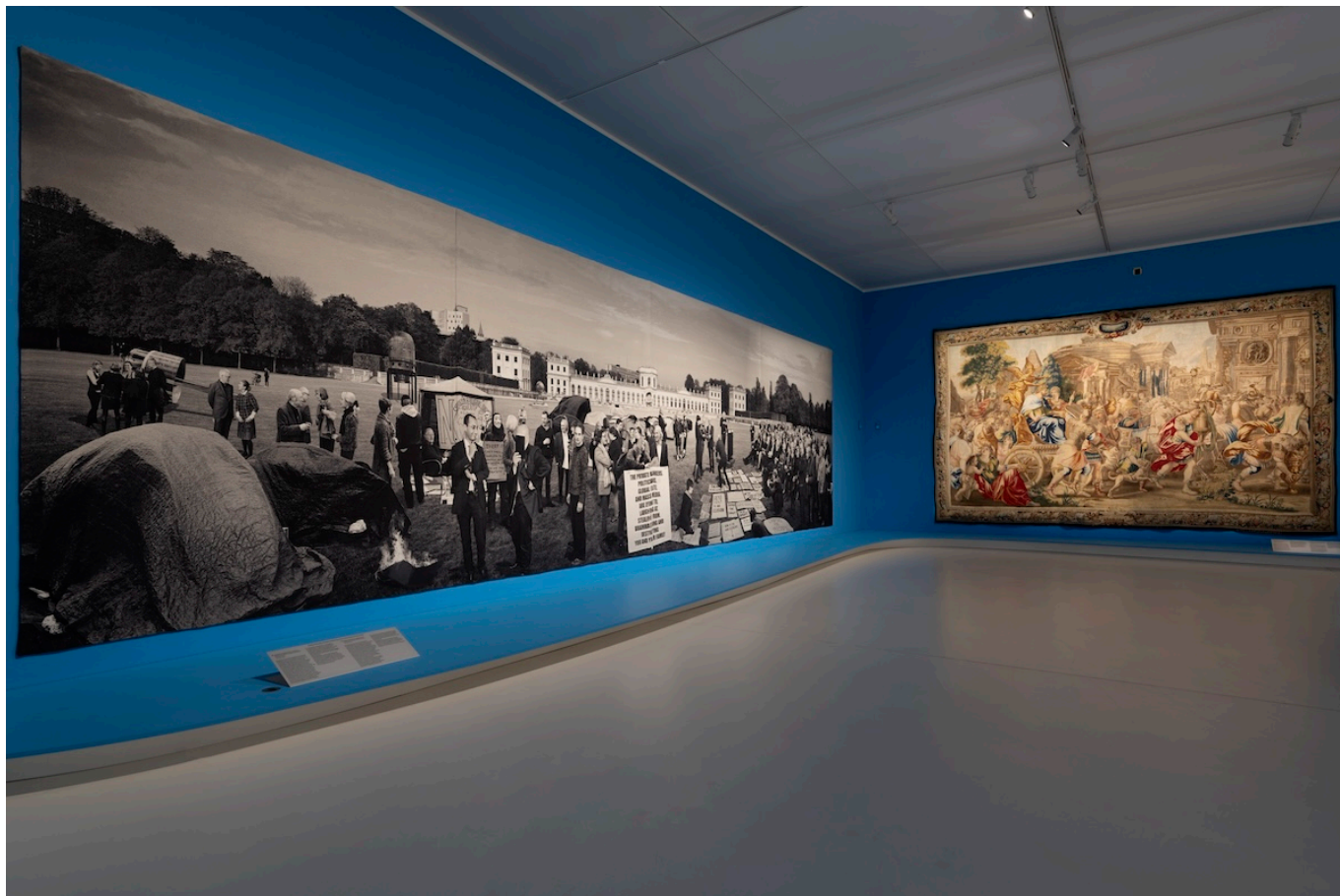
Mudac, Tisser son temps, Vue d'exposition, 2025

Монументальные гобелены фламандских мастеров XVII века висят рядом с текстильными работами современных художников Гошки Макуги и Грейсона Перри – и это соседство создает своеобразный диалог сквозь время. Сопоставление полотен показывает, что посредством ткачества как четыреста лет назад, так и сегодня можно вызывать размышления об универсальных проблемах войны, мира, динамики власти, социальной борьбы, потребления, глобализации. Да, современные ткацкие станки программируются и автоматизируются специалистами с помощью цифровых технологий, но в основе лежат те же традиционные техники ткачества и те же приемы. Вдруг становится очевидным, что между старинными брюссельскими гобеленами из серии «Деяния Сципиона Африканского» (1660), а также текстильным манифестом Макуги «Смерть марксизму, женщины всех стран, объединяйтесь!» (2013) и серией Перри «Тщеславие мелких различий» (2012) много общего. С одной стороны, все работы служат средством передачи сильного политического и социального послания и отражают определенные мировоззрения и идеологии. Однако если раньше дорогостоящие гобелены заказывались политической элитой для прославления своих реальных или воображаемых подвигов и укрепления собственного влияния, то сегодняшние художники используют этот традиционный вид искусства как оружие социальной и политической критики.