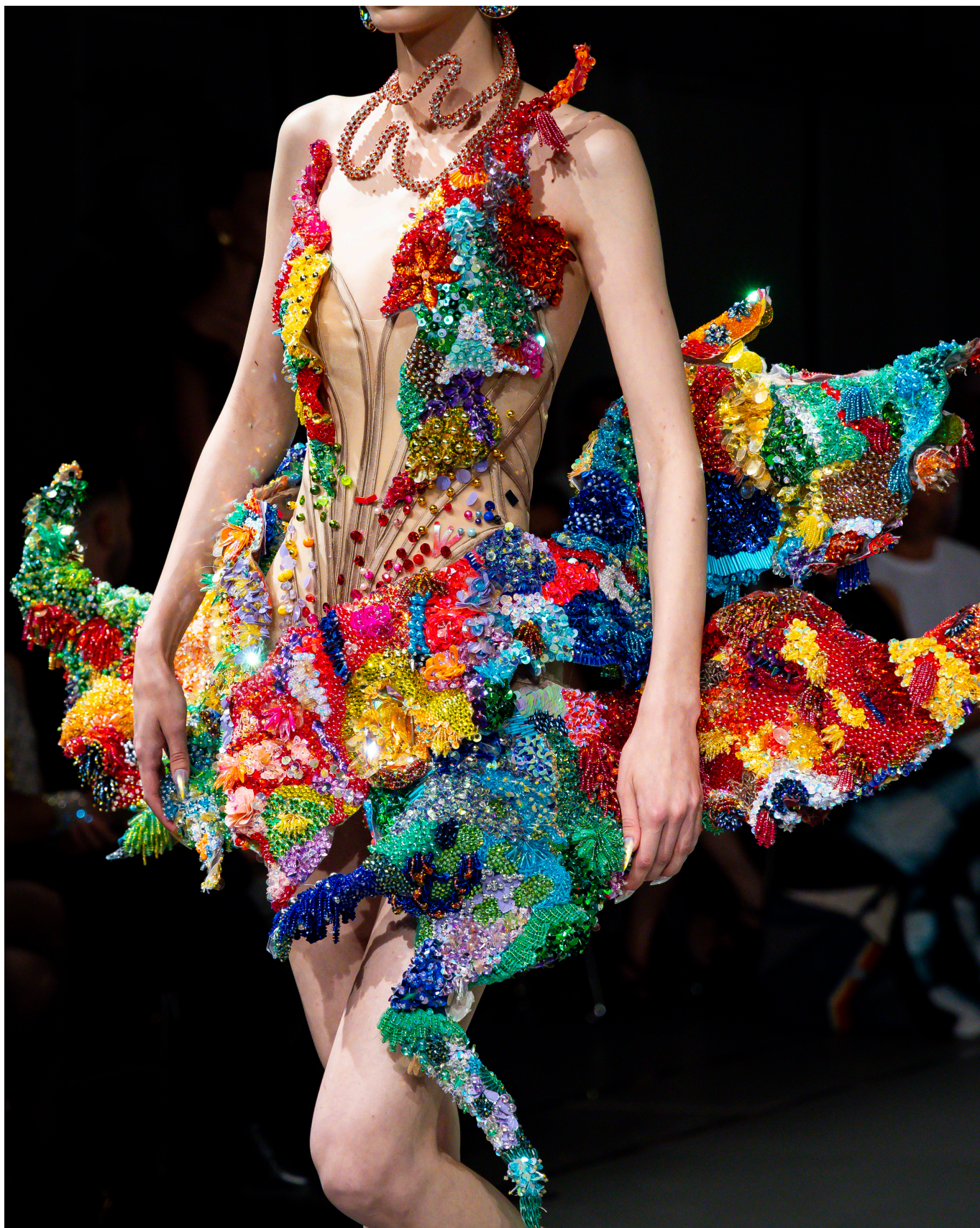
Germanier x Nguyen Tien Truyen, Haute Couture, FW25-26, Les Joueuses, 2025

Секрет популярности дизайнера у широкой аудитории мы разгадали, наблюдая за его выступлением на открытии выставки. В своей речи он поблагодарил семью, друзей, партнеров, упомянул даже свою собаку, а в конце чуть не расплакался, сказав, что без поддержки самой публики этот успех был бы невозможным.