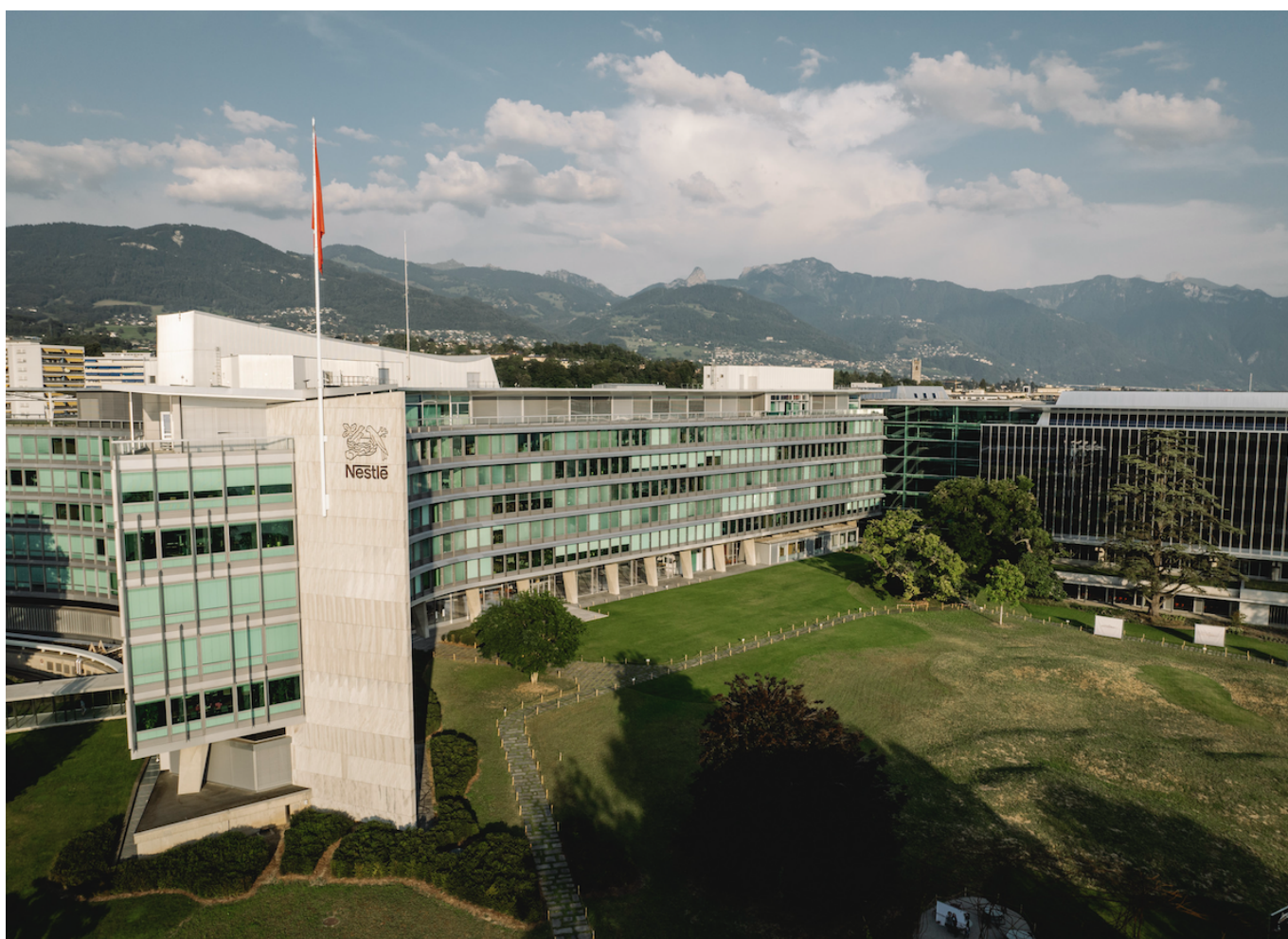
Штаб-квартира Nestlé в Веве

Автор: Заррина Салимова, Вебе , 21.10.2025.