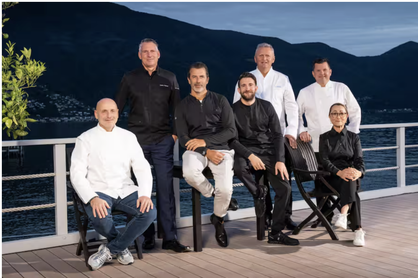
«Клуб 19».