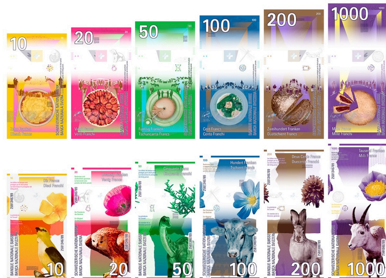
Банкноты концепта А.

Автор: Заррина Салимова, Берн , 18.08.2025.