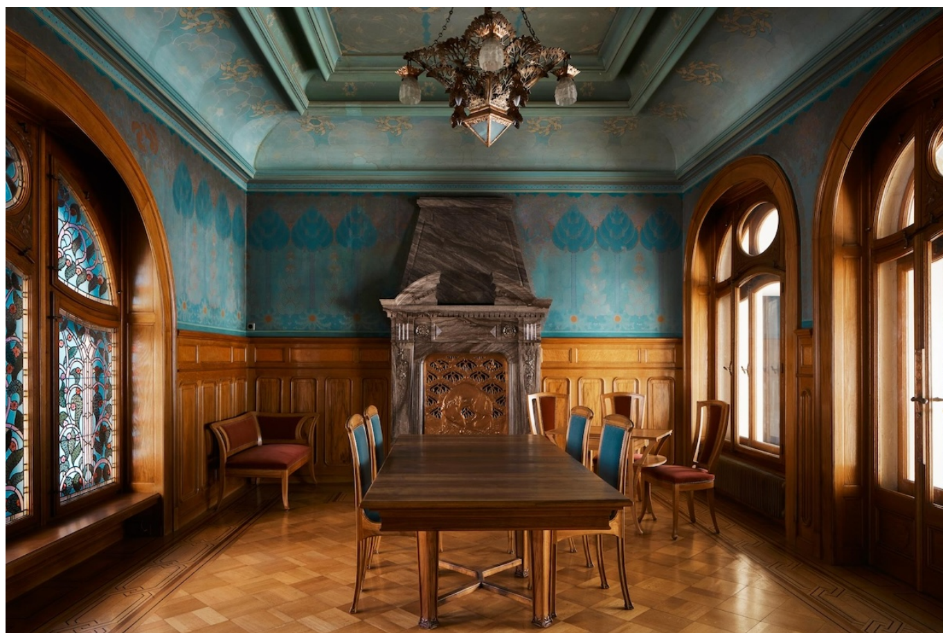
Голубой салон

В этом году акция пройдет уже в девятый раз, причем одну из самых насыщенных программ подготовили Ла-Шо-де-Фон и Ле-Локль . Напомним, что два города в Невшательской Юре были включены в список объектов культурного наследия Юнеско в 2009 году – за свою уникальную планировку. Ла-Шо-де-Фон и Ле-Локль называют «городами-фабриками», так как каждое архитектурное решение, от расположения кварталов до шахматной схемы улиц, продиктовано потребностями часовых мануфактур и производителей деталей для часовых механизмов. Улицы, например, проложены под прямым углом, формируя квадратные кварталы на плане города, а многие дома были спроектированы таким образом, чтобы сочетать в себе жилые, производственные и административные помещения.