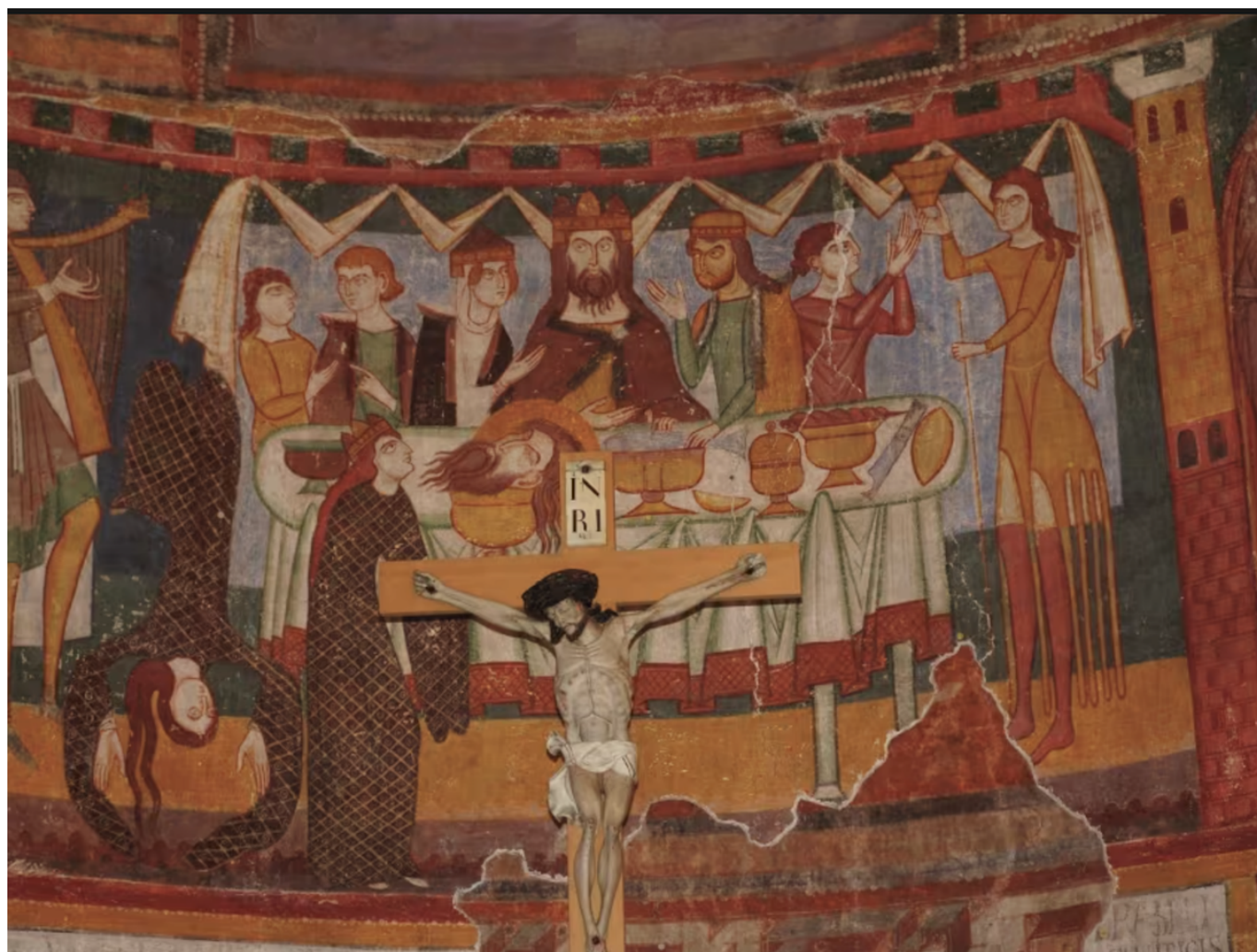
Фрески в монастыре Св. Иоанна

большой и хорошо сохранившийся цикл фресок эпохи Высокого Средневековья.