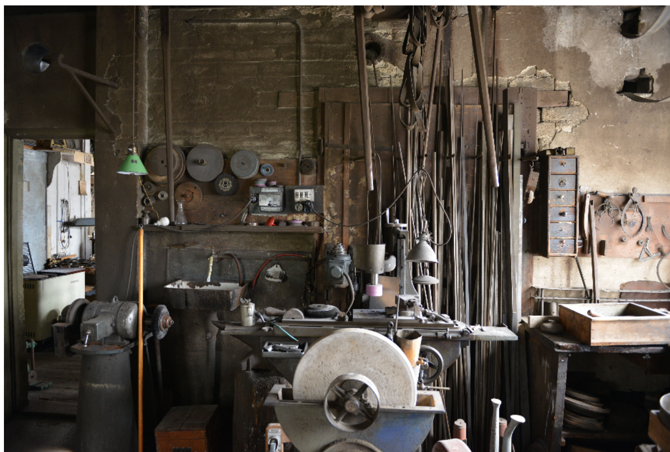
«Забытая» часовая мастерская.

Помимо традиционных экскурсий, посвященных часовому прошлому Ла-Шо-де-Фона и Ле-Локля, в программу Дней наследия включено посещение уникального объекта – забытой часовой мастерской, обнаруженной около десяти лет назад на первом этаже обычного здания в Ла-Шо-де-Фоне. Металлические лампы, готовые к работе станки, инструменты на стенах и загадочные шестеренки – ателье выглядит так, будто часовщик только что вышел по делам и вот-вот вернется обратно. Зайти в мастерскую можно только по предварительной записи, поэтому не упустите эту редкую возможность.