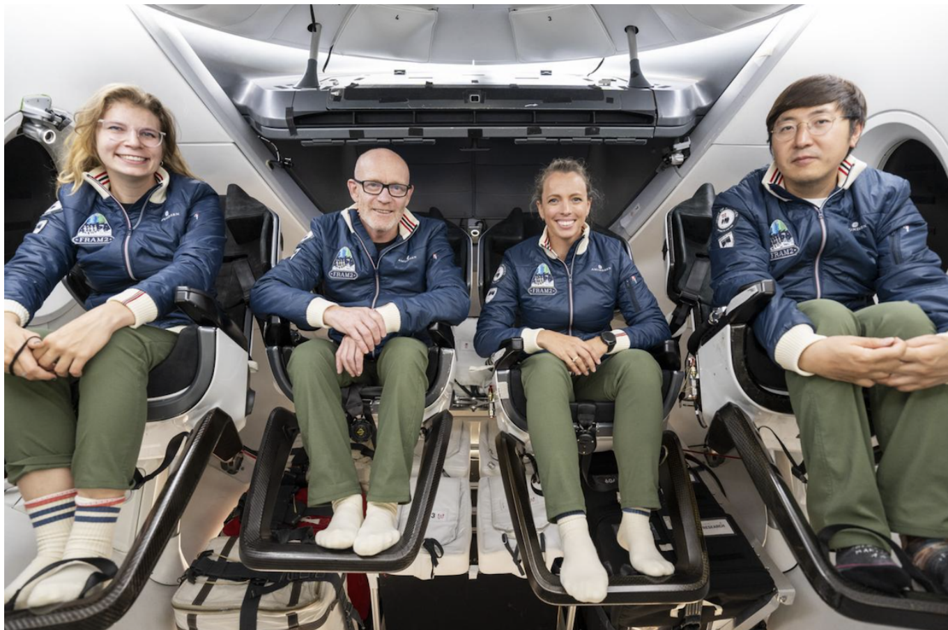
Экипаж Fram2.

В программе – 22 крупных научных эксперимента, таких как получение первых рентгеновских лучей в космосе и выращивание грибов в условиях микрогравитации. У исследователей также появится возможность изучить регуляцию человеческих генов в условиях длительного пребывания в космосе. Одно из исследований ведется Цюрихским университетом.