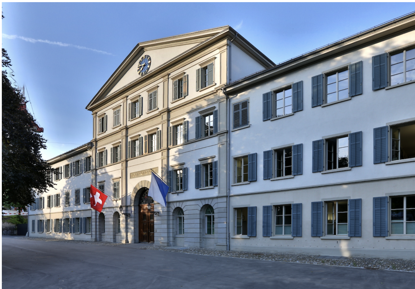
Здание Высшего суда Цюриха.

Автор: Заррина Салимова, Берн , 11.11.2024.