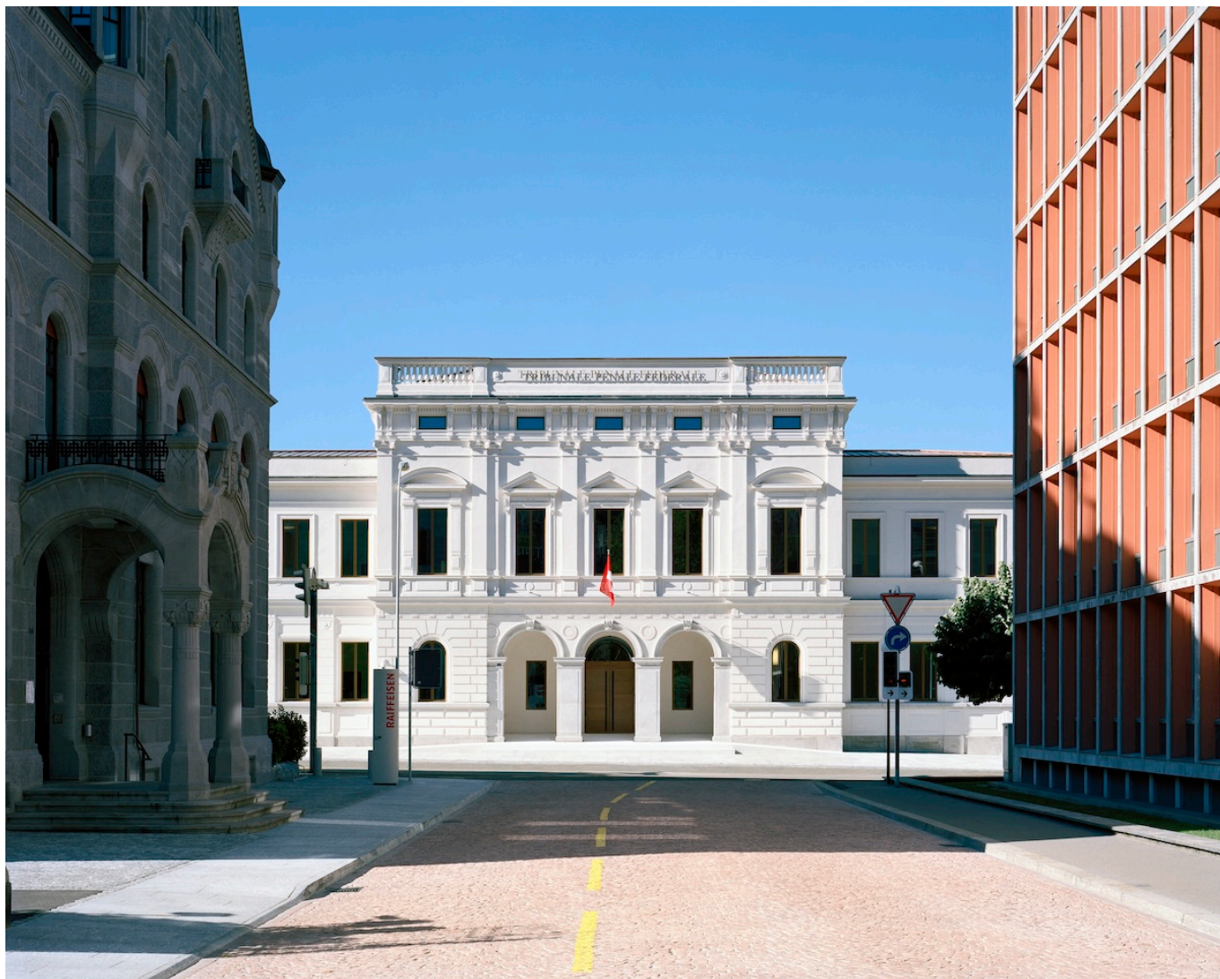
Фото: Tonatiuh Ambrosetti, Lausanne (c) Confédération suisse / OFCL

Автор: Заррина Салимова, Беллинцона , 23.08.2024.