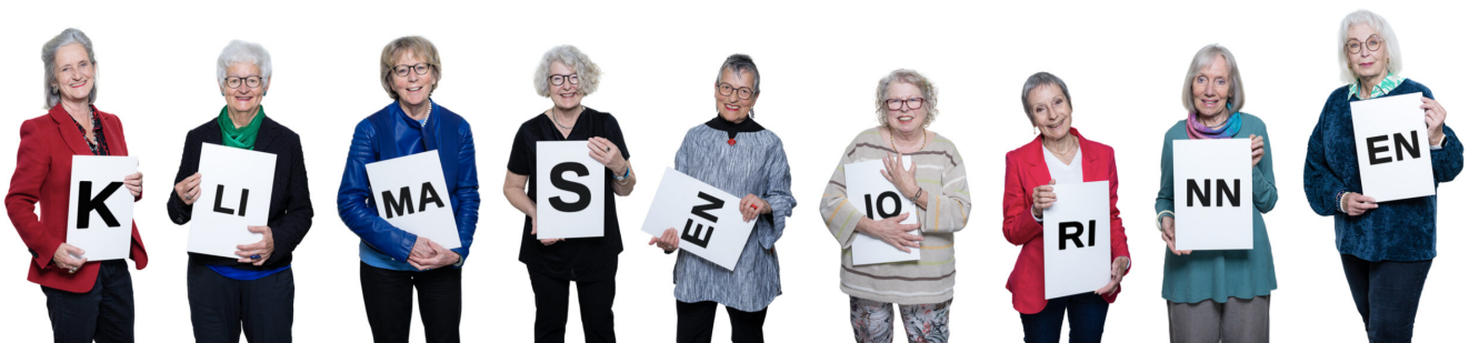
Те самые «бабушки».

Помимо ассоциации «Пожилые женщины за климат», в которую входят две с половиной тысячи швейцарок, средний возраст которых превышает 70 лет, индивидуальные жалобы подали также четыре ее члена, однако эти иски были отклонены. В целом, борьба швейцарских пенсионерок с собственными властями продолжается уже несколько лет. Дойти до Страсбурга их вынудило вынесенное в мае 2020 года решение Федерального суда, отклонившего апелляцию ассоциации и постановившего, что пожилые женщины страдают от последствий изменения климата не больше, чем другие группы населения.