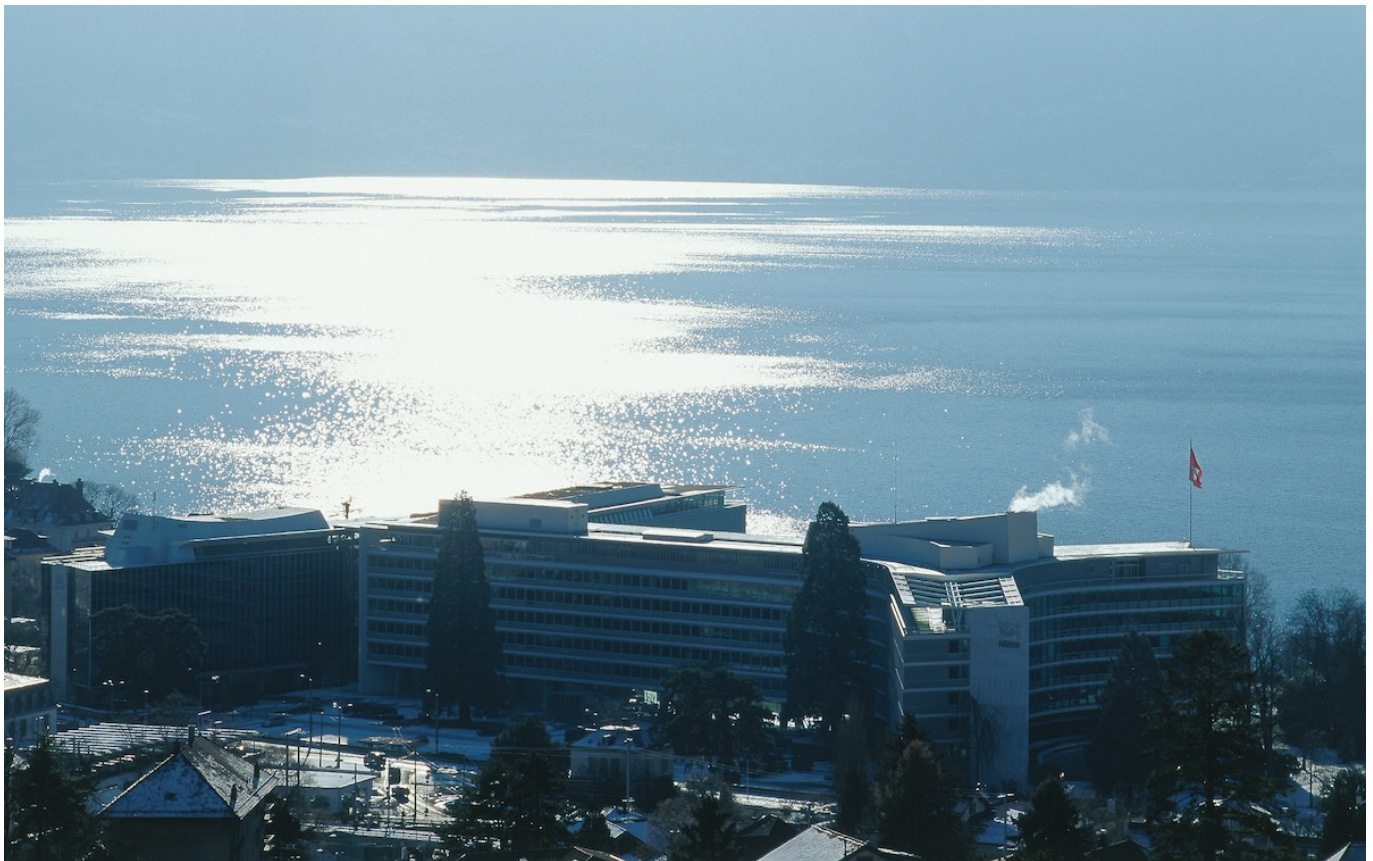
Штаб-квартира Nestlé в Ве́ве (с) Nestlé

Автор: Заррина Салимова, Ве́ве , 05.02.2024.