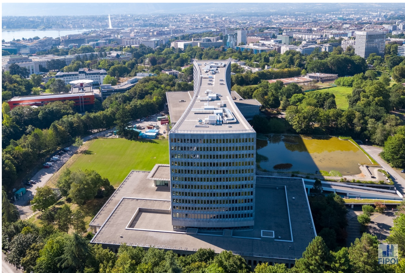
Здание штаб-квартиры МОТ в Женеве.