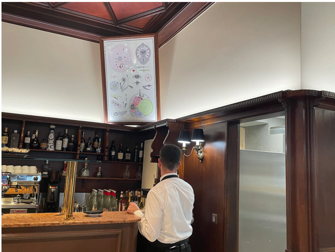
Интерьер ресторана