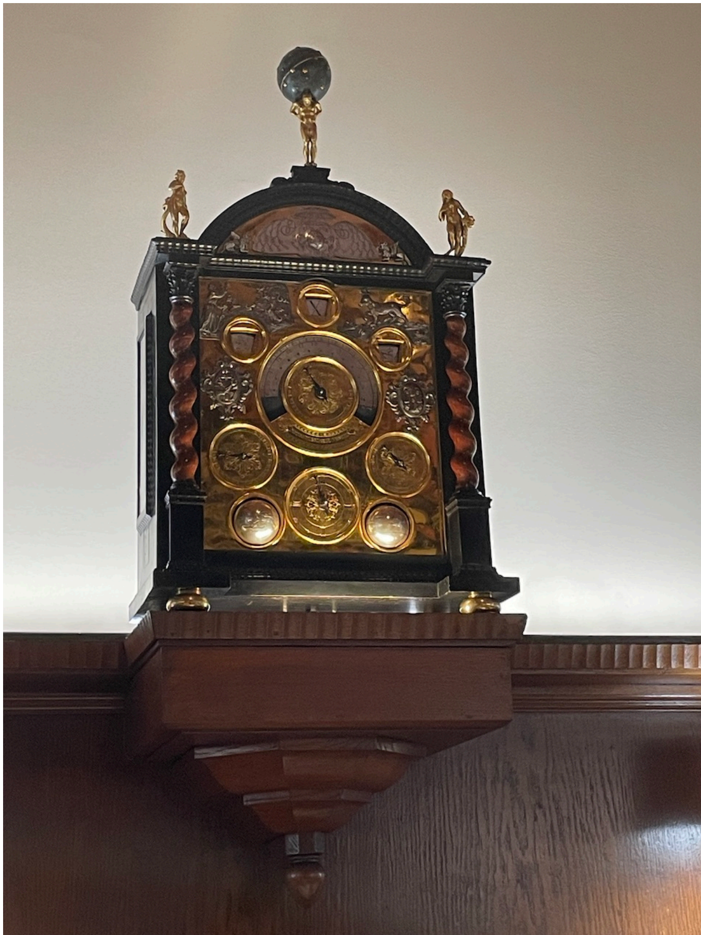
Старинные часы еще идут!

Но, в конце концов, люди ходят в ресторан не только и не столько для того, чтобы любоваться интерьером. Не беспокойтесь, качества еды тоже гарантировано.