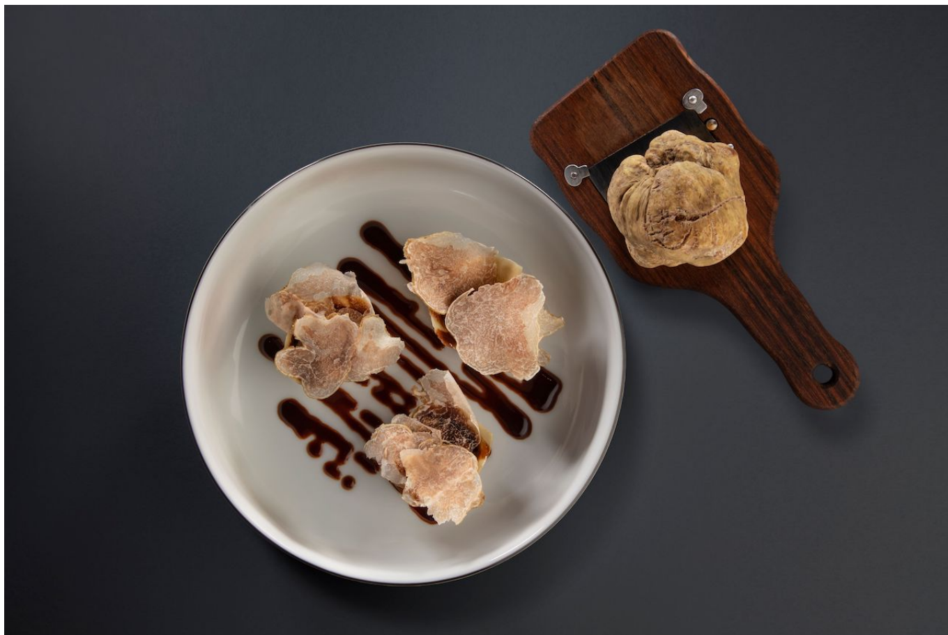
Равиоли с зайцем и белым трюфелем