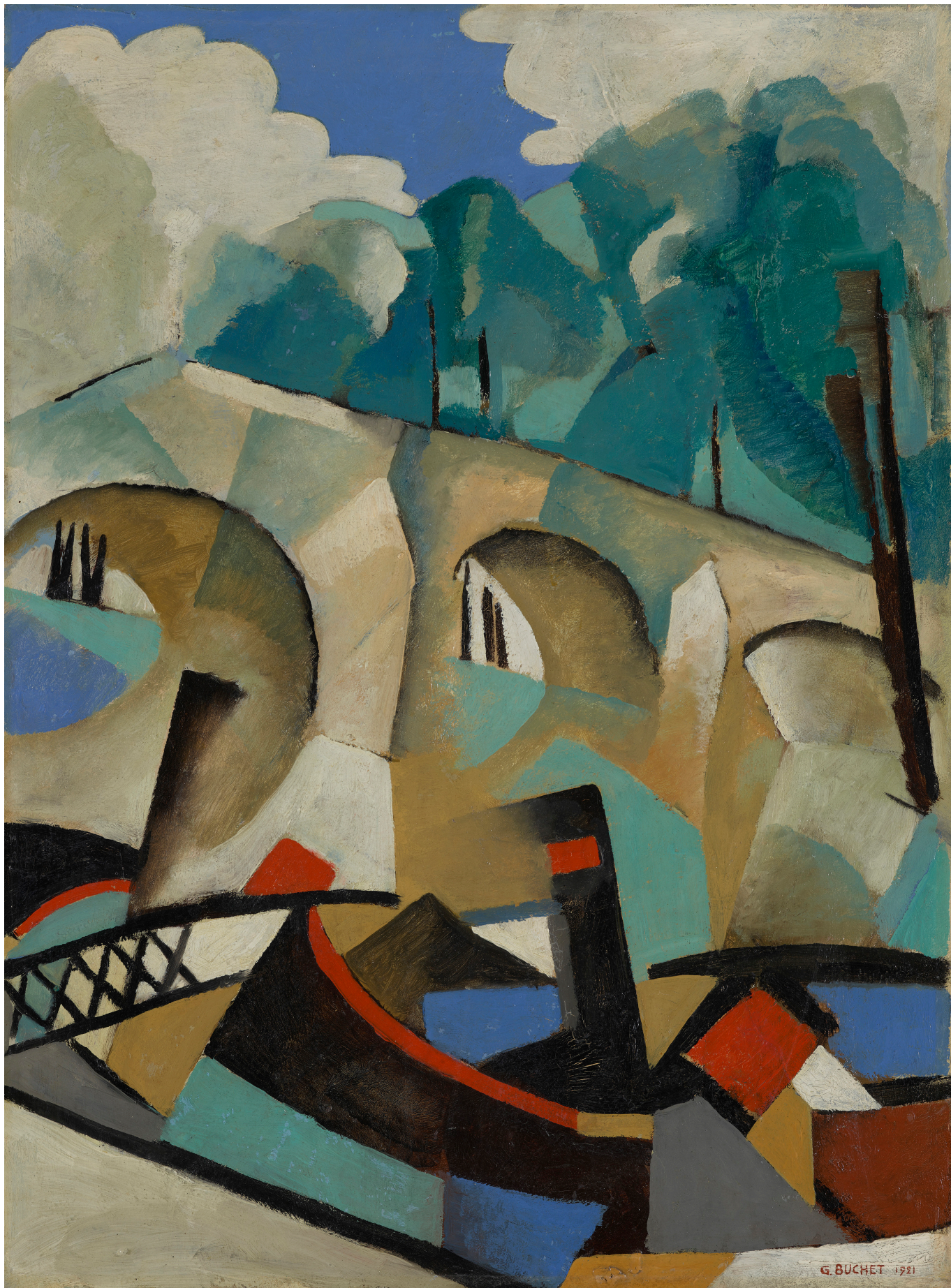
Гюстав Бюше. Мост и буксир, 1921 г. © 2022 Gustave Buchet. Familles Bron Bersier Biber. Photo: MCBA

Отношения Бюше с дадаистами были непростыми. В то время как дадаизм