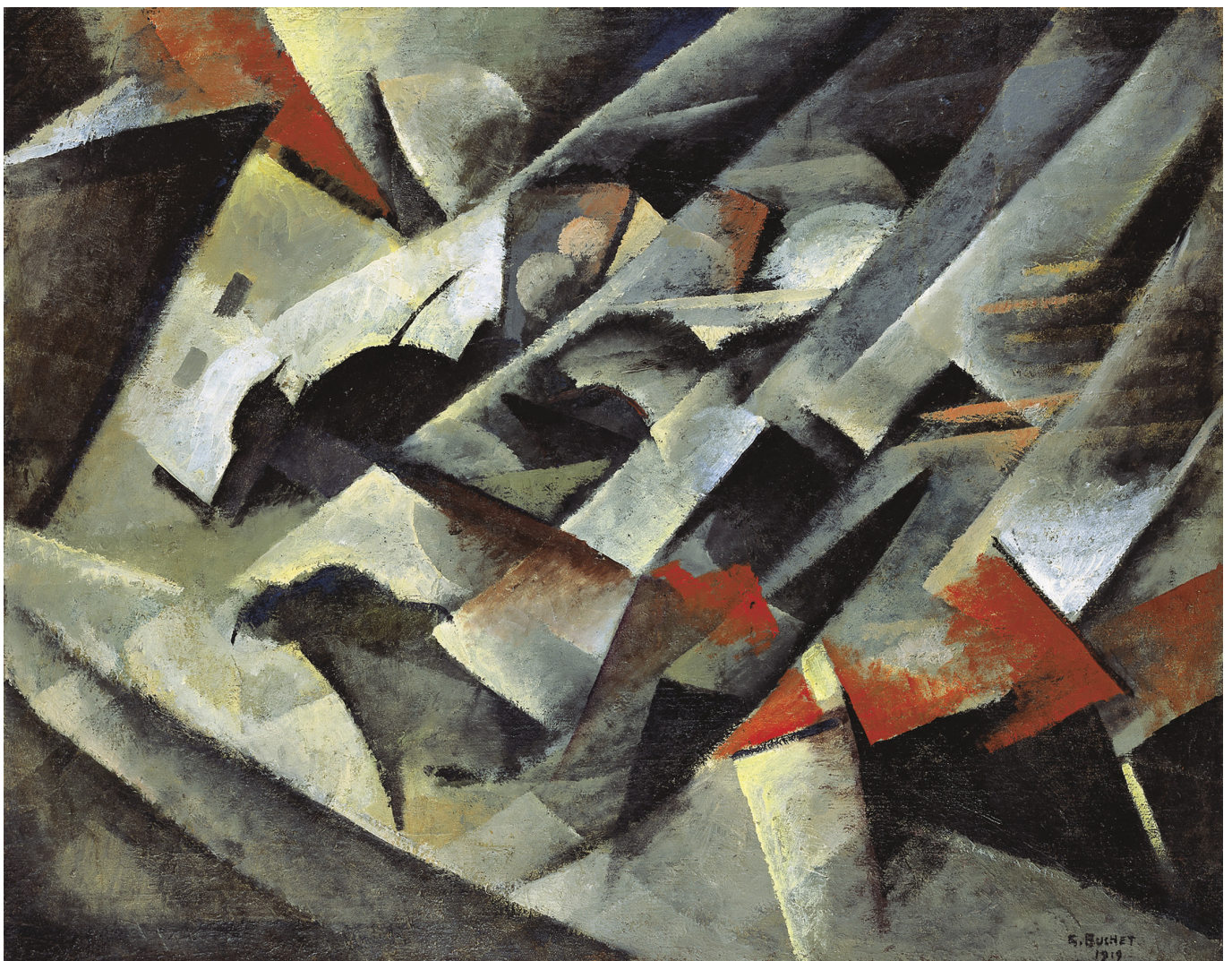
Гюстав Бюше. "Гроза", 1919 г. © 2022 Gustave Buchet. Familles Bron Bersier Biber.

Автор: Надежда Сикорская, Лозанна , 12.07.2022.