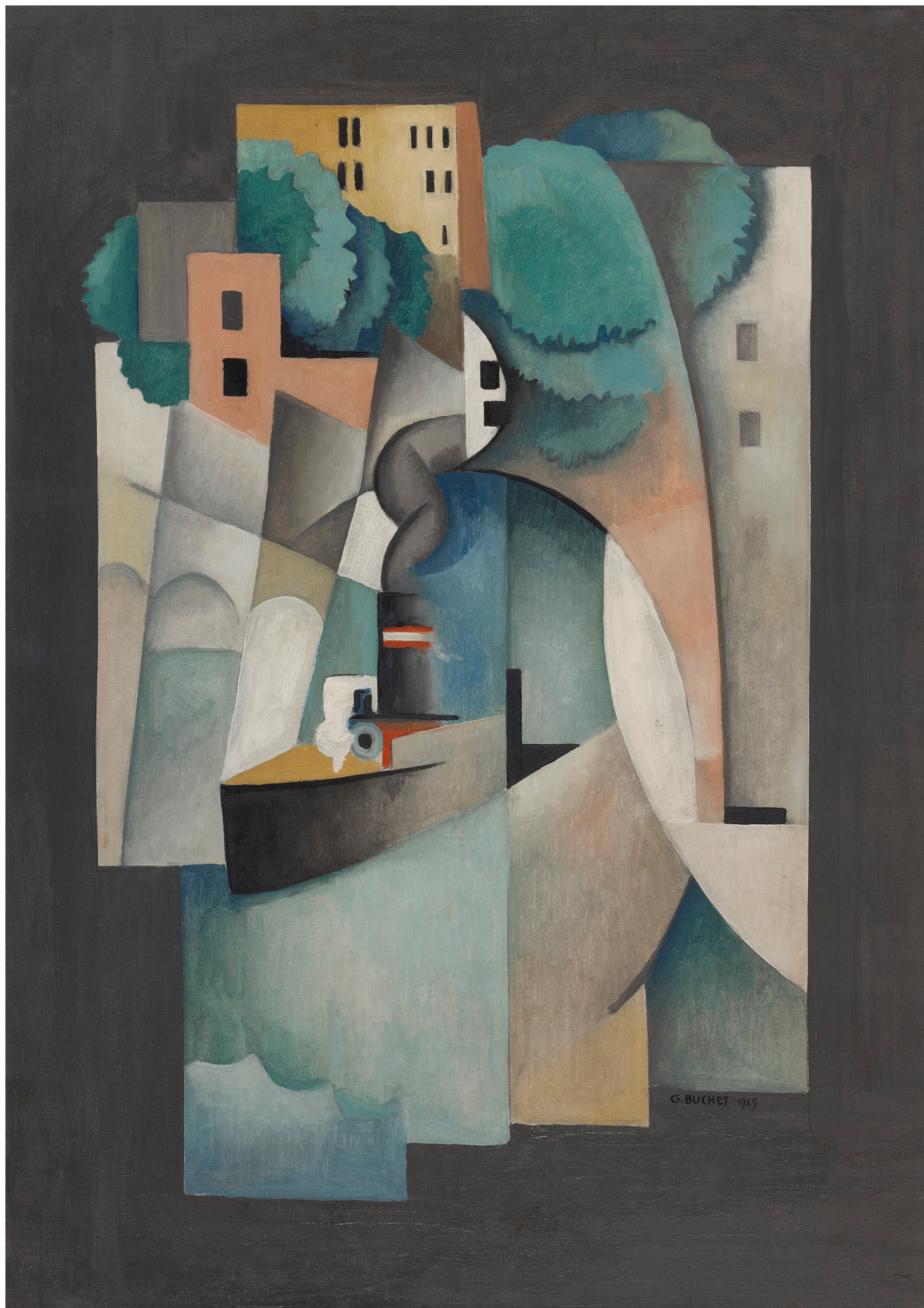
Гюстав Бюше. Берег Сены весной, 1929 г. © 2022 Gustave Buchet. Familles Bron Bersier Biber.