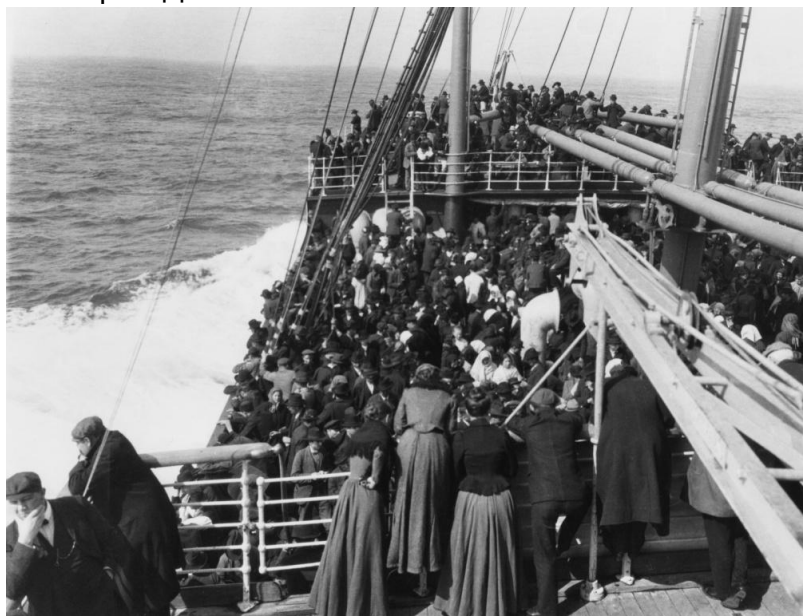
Корабль с эмигрантами, ок. 1905 г.