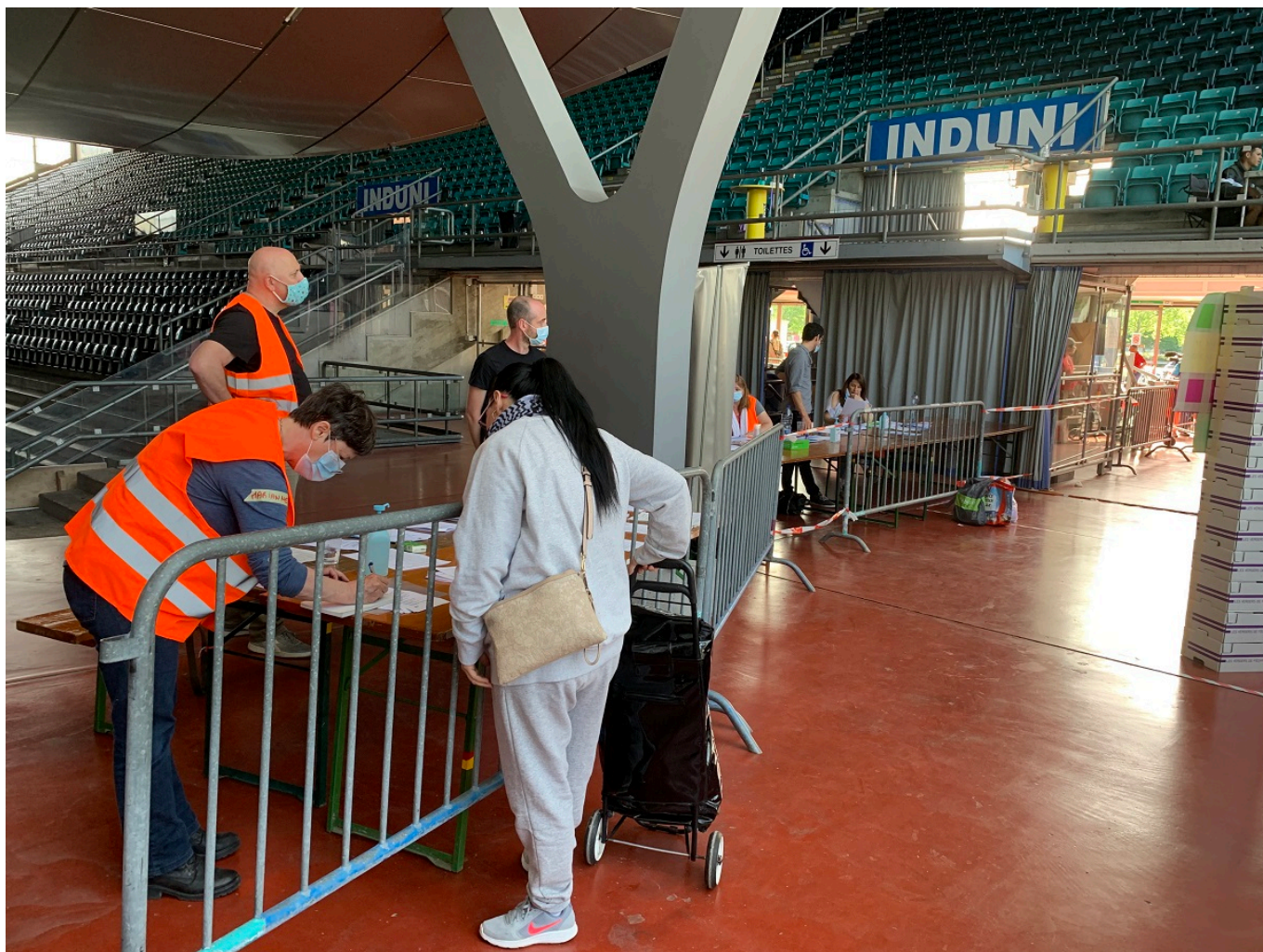
Распределение бесплатной еды в Женеве.

Тем временем, в субботу в Женеве снова выстроилась километровая очередь за бесплатными пакетами с едой и средствами гигиены. 554 из 2000 пришедших за гуманитарной помощью человек согласились заполнить анкеты и рассказать о своем социальном статусе. Выяснилось, что только 40% из них имеют медицинскую страховку. 52% обратившихся за помощью – это нелегальные мигранты, 28,3% – иностранцы с видом на жительство, 4,5% – просители убежища, 3,6% – швейцарцы.