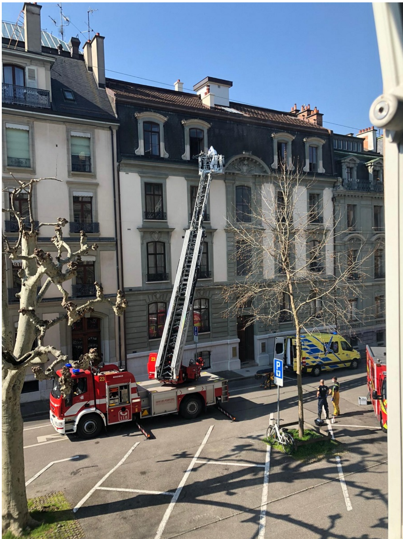
заболевшего выносят из квартиры на носилках с помощью пожарного крана