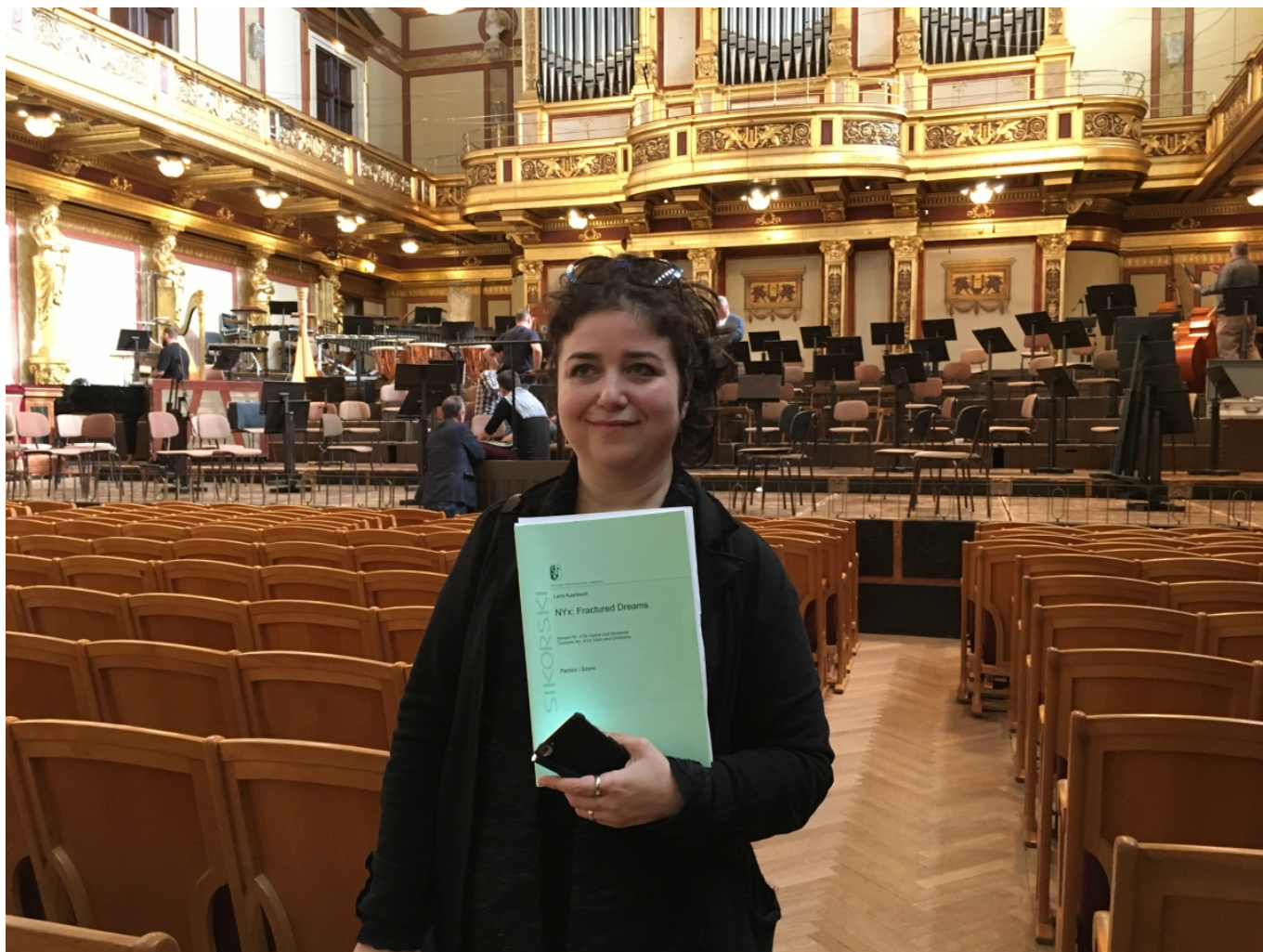
Лера Ауэрбах перед концертом в Венской филармонии. Октябрь 2017 г.

На его афише имена трех композиторов: Моцарт, Ауэрбах и Канчели. Негласная тема вечера, как объяснила нам хорошо известная читателям Лера Ауэрбах, - жизнь и смерть. Небольшое пояснение. Концерт № 20, написанный 29-летним Моцартом в 1785 году, - единственный, вместе с 24-м, в минорной тональности. (Заметим, кстати, что впервые он был исполнен автором... в венском казино Мельгрубе.) По мнению музыковедов, его главная тема - грусть по уходящему времени, которое не остановить, «есть только миг между прошлым и будущим».