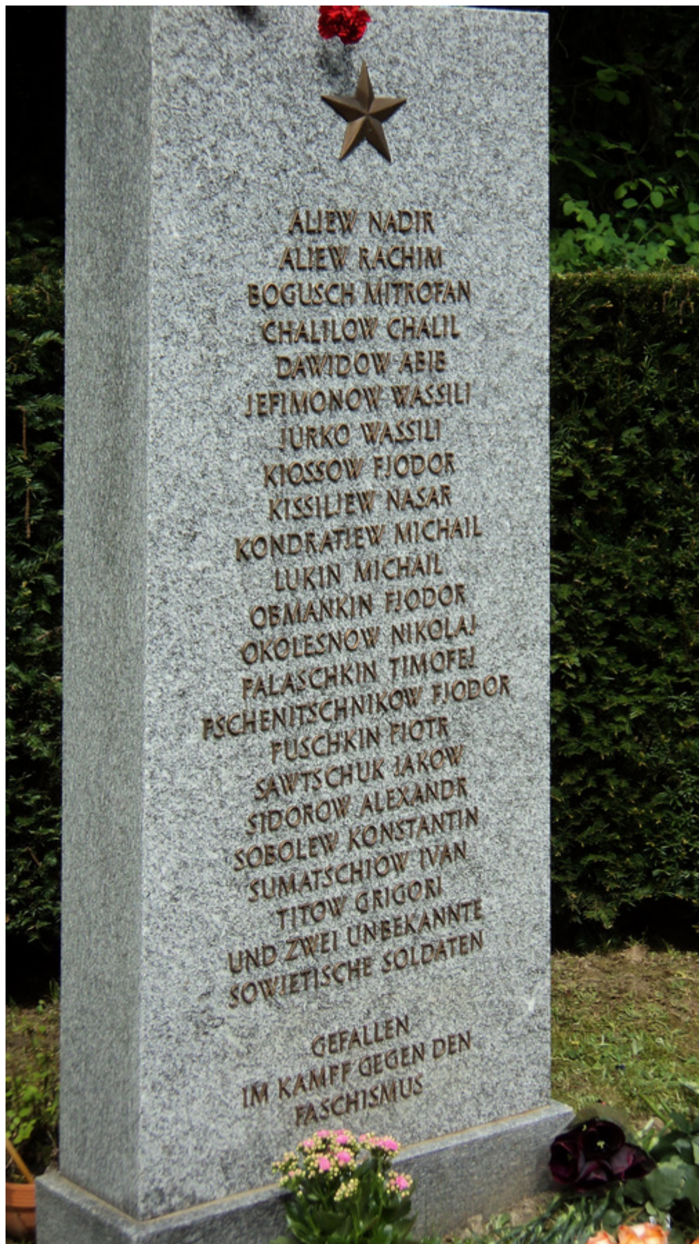
Памятник советским солдатам на кладбище Хернли в Базеле с фамилией Пшеничникова.

Дело о смерти было закрыто. Закрыта была и история интернированных. Те, кто