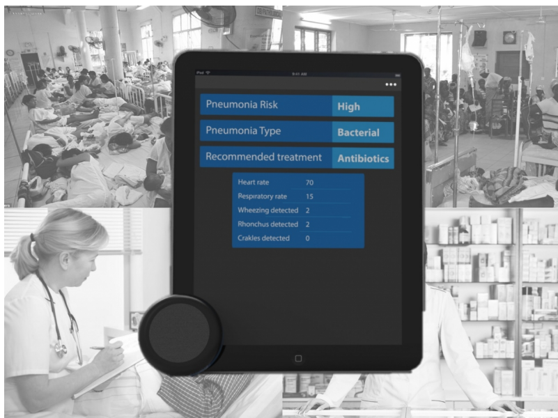
Смарт-стетоскоп в действии

«По мнению ряда экспертов, традиционный стетоскоп не очень удобен в использовании, а на его освоение требуется значительное время. Конечно, электронный стетоскоп существует уже давно, но сегодня его редко применяют в клиниках. Интеллектуальный прибор поможет сократить время обучения, необходимое для овладения техникой его использования, а также расширит возможности диагностирования, так как полученные данные можно будет отправлять коллегам для проведения консультаций», - рассказал Пьер.