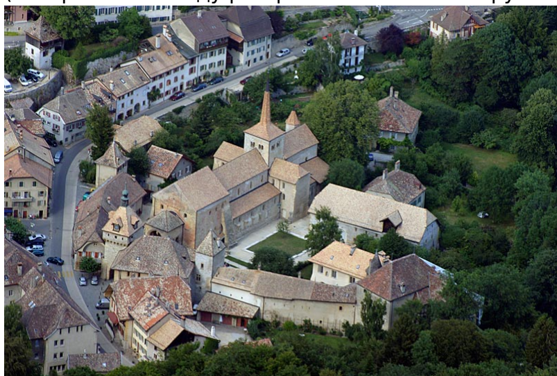
Аббатство в Роменмотье

В 573 году епископом Аванша избран Мариус – он возглавлял Церковь Гельветов вплоть до своей смерти 31 декабря 593 года. Это был типичный представитель тогдашнего духовенства: выходец из семьи богатых землевладельцев из бургундского города Отен (территория современной Франции), он сам владел землями во многих городах Галлии. Поддерживал тесные связи с аристократией и высшим духовенством того времени. По-видимому, именно Мариус перенес около 585 года епископскую резиденцию из Аванша на юг – к Леману, в солнечную Лозанну. Возможно, на его решение повлияла угроза со стороны вторжения алеманнов (которые в 610 году разграбили селения вокруг Аванша).