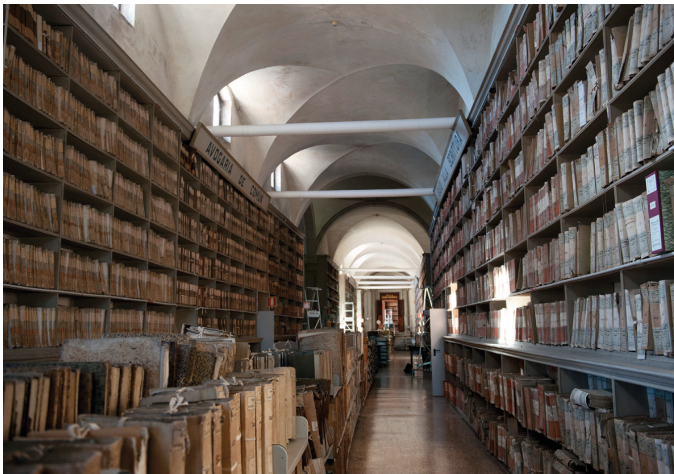
Один из коридоров венецианского архива

Как это работает? С технической точки зрения, перед Venice Time Machine немало сложных и интересных задач. Чтобы оцифровать и проанализировать большой объём данных, участники проекта оптимально организовали свой рабочий процесс, разделив его на несколько частей, в соответствии с методами и алгоритмами исследования. Группа итальянских учёных занимается сканированием документов на высокотехнологичных машинах, созданных в EPFL. Эти сканеры сильно отличаются от привычных нам: они позволяют обрабатывать более 1000 документов в час, а также сканировать книги, не переворачивая страницы. Далее рукописные тексты на редких языках, таких как латынь или староитальянский, необходимо транскрибировать. Это делается при помощи логического преобразования каждого слова в картинку. Затем ищется похожая картинка в других документах, слова распознаются, соединяются в предложения, и вот перед нами расшифрованный контракт итальянского рабочего, скажем, XIX века.