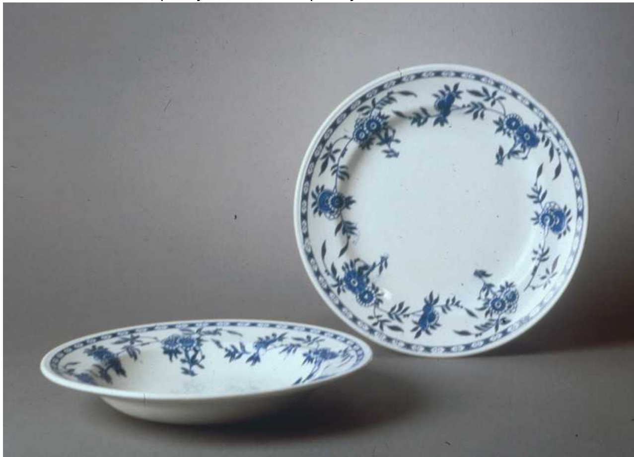
Посуда для пассажиров второго класса

Обломки «Титаника» лежат на глубине 3750 м. Впервые их обнаружила экспедиция руководитель лаборатории глубоководных исследований океанографического института в штате Массачусетс Роберта Балларда в 1985 году. 280 представленных в Женеве предметов были подняты – вместе с 5 500 другими – со дня океана американской компанией RMS Titanic, Inc., единственной, легально имеющей право на проведения поисков в зоне крушения лайнера. Путешествующую выставку, главными целями которой организаторы называют сохранение культурного наследия корабля и памяти его пассажиров, успели посмотреть уже 25 миллионов человек.