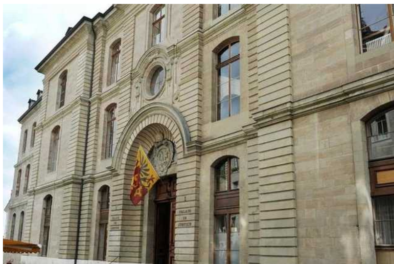
Женевский дворец правосудия