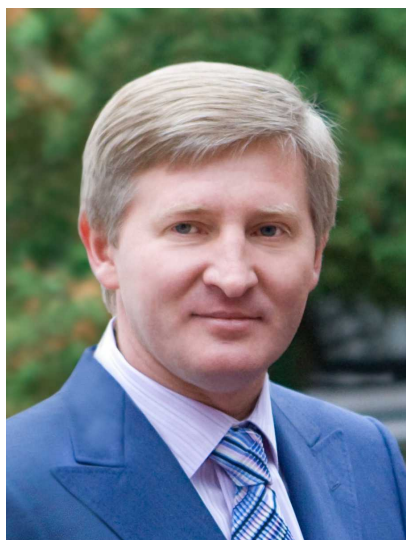
Ринат Ахметов

События последних месяцев на Украине нашли отражение в характеристике еще одного представителя постсоветского пространства среди самых влиятельных людей мира по версии Bloomberg. В одной категории с Игорем Сечиным оказался основатель украинской финансово-промышленной группы System Capital Management Ринат Ахметов. Эксперты Bloomberg отмечают, что он «пытается удержать своих работников от присоединения к пророссийским силам и сохранить в своей власти промышленную империю, которая сделала его богатейшим человеком Украины».