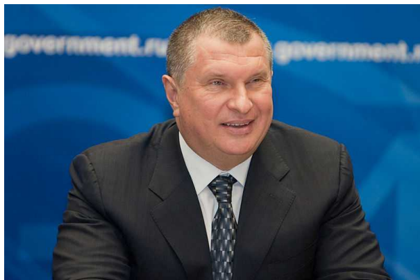
Игорь Сечин д.]».

В категории «влиятельные фигуры корпоративного мира» Bloomberg отметил президента российской государственной нефтегазовой компании Игоря Сечина. О нем говорится следующее: «Управляет самой крупной в мире по объему добычи и имеющимся запасам нефтяной компанией, акции которой котируются на бирже. Достаточно близок к Путину, чтобы заслужить санкции США».