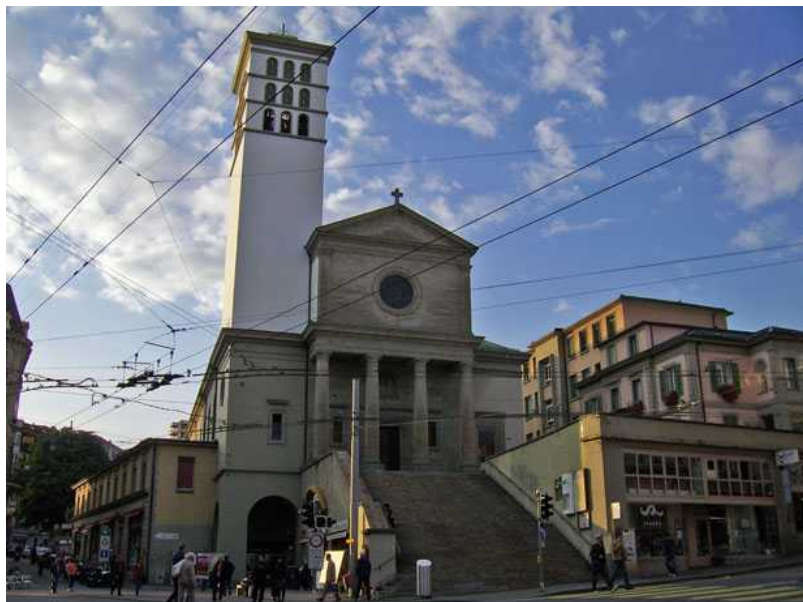
Нотр-Дам дю Валентен

1832-1835 годах на улице Валентен. Неоклассический стиль отличает и современное реформатское сооружение в Круа д'Уши. В конце XIX – начале XX века в моде были неороманский, неоготический стили, а также эклектический стиль и стиль «Хаймат», также называемый швейцарским или региональным.