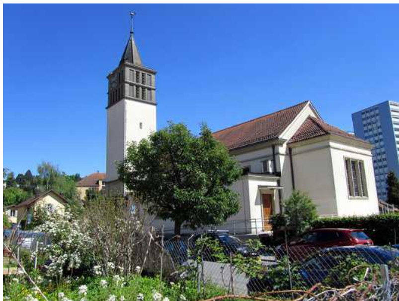
Церковь святого Луки, коммуна Бельво

Теперь посмотрим внимательнее на развитие архитектуры церквей Лозанны. Для эпохи Средневековья были характерны романский и готический стили (памятниками которого являются церковь святого Франциска и часовня Маладьер). До проведения Реформы религиозных сооружений было много (пик строительства соборов пришелся на XIII век), однако с 1536 года их число стало постепенно уменьшаться.