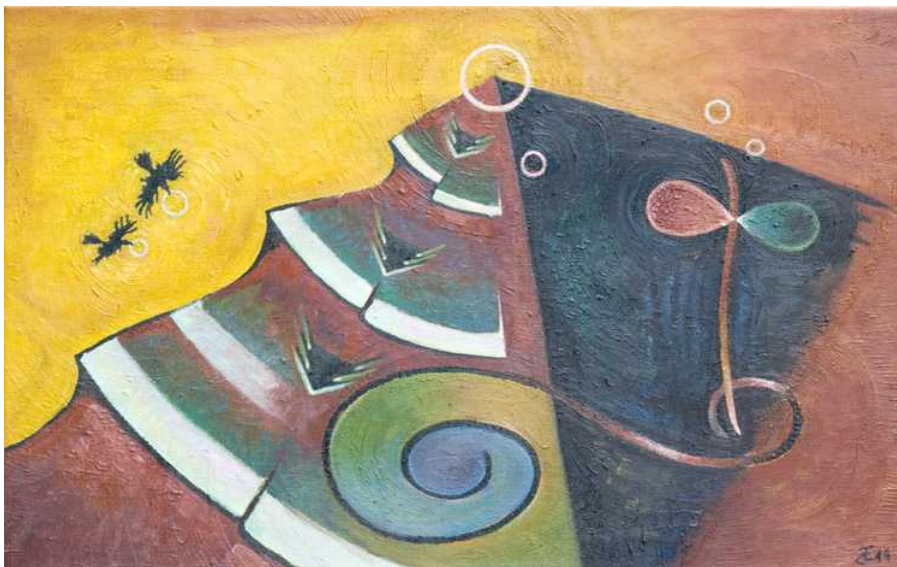
«Вороны и пузыри». Х., масло, 2014

ые в одном месте, излучают особую энергетику. Вспомним толпы туристов, пробегающих торопливо по залам Лувра, Прадо или Эрмитажа. У них нет времени остановиться на мгновение и замереть хотя бы у одного шедевра Веласкеса или Микеланджело. Но даже такой легкомысленный турист покидает музей совсем другим человеком. Подпитанным энергетикой искусства, даже помимо его воли. В