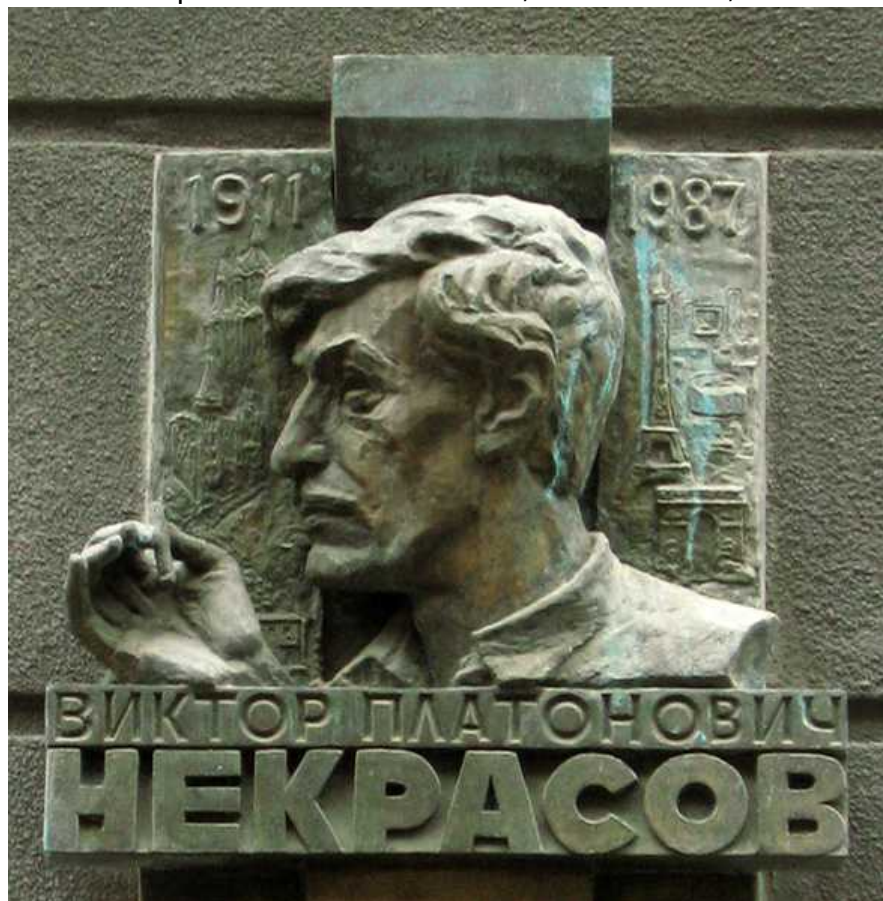
Мемориальная доска на доме в Киеве, где жил Виктор Некрасов

А самое поразительное в нем – и, может быть, он это не совсем сознает – вот что: