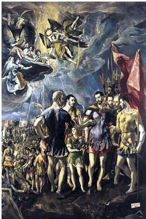
Эль Греко. «Страдание святого Маврикия» (Википедия)

Магическое значение цифр пленяло воображение умов человеческих с древнейших времен. В цифрах заключены тайны мироздания, на математике зиждется вселенная - уверяли библейские богословы, вавилонские жрецы, древнегреческие звездочеты. Также увлекались разгадыванием таинственного смысла цифр и гельветские мудрецы - «предки» нынешних швейцарских ученых.