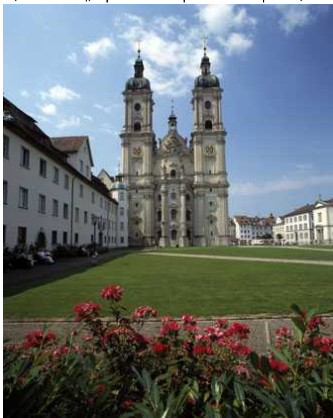
Собор Санкт-Галленского аббатства

И, наконец, третий вопрос: в то время, как вы будете давать ответы на мои