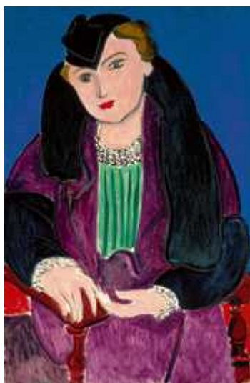
Анри Матисс, Портрет в голубом пальто, 1935 (© Collection Nahmad, Kunsthaus Zürich)

Параллельно с ретроспективой Герча Кунстхаус представляет выставку словацкого художника Романа Ондака, одного из ярких представителей современного искусства, смешивающего в своих работах рисунок, фотографию, скульптуру и перформанс. Для государственного музея Цюриха Ондак разработал совершенно особый концептуальный проект.