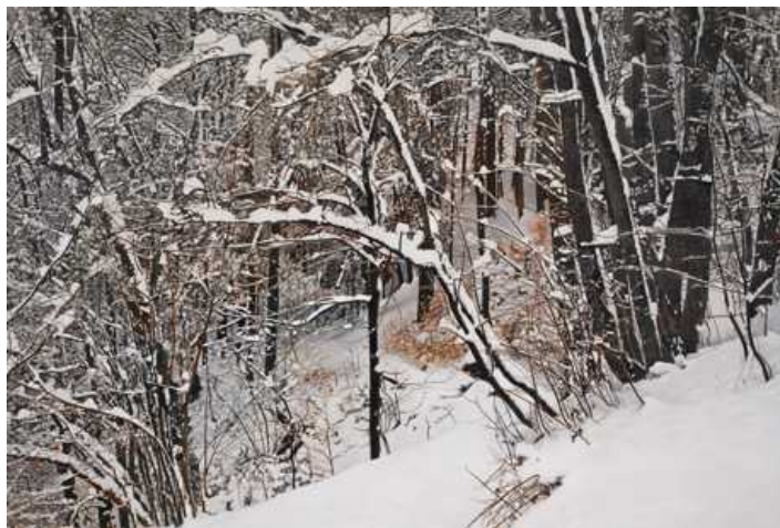
Франц Герч, Зима, 2009

Только что законченный Францем Герчем цикл «Четыре времени года» стал центром большой ретроспективы, посвященной творчеству современного швейцарского художника. За рубежом Герч известен, прежде всего, как представитель гиперреализма и прославился своей «ксилографической техникой», уникальной в отношении используемых материалов и форматов.