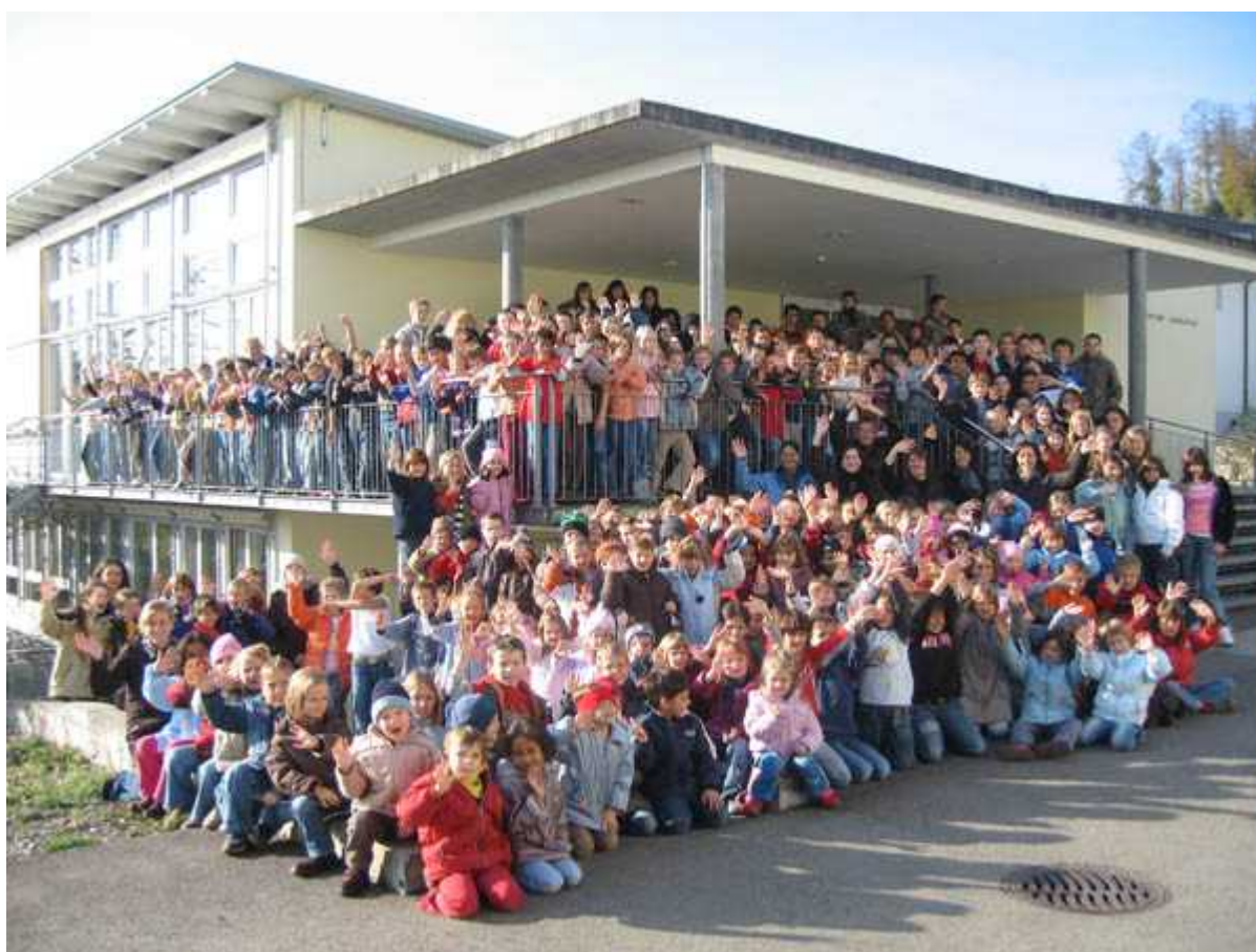
Школа в Ленцбурге

Автор: Людмила Клот, Цюрих , 06.09.2010.