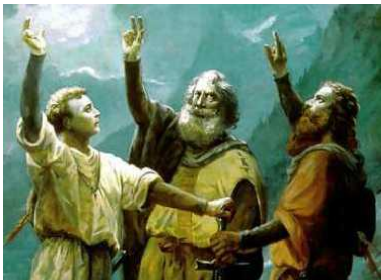
Трое авторов Федерального пакта 1291 года

Автор: Людмила Клот, Грютли , 30.06.2010.