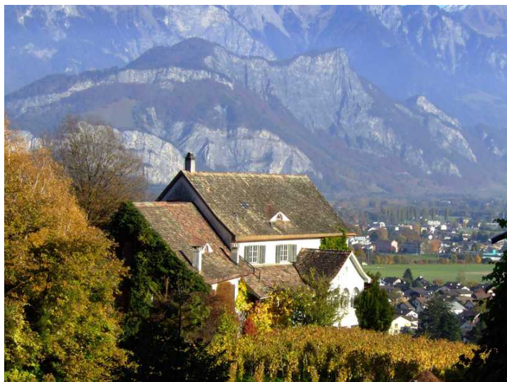
Хайдиланд - популярный туристический маршрут

вдохновляет не только путешественников, но и туристические бюро. Все, придуманное сочинительницей Спири, детально воплощено здесь в жизнь: вы можете посетить «настоящую» деревню Хайдидорф, где «жила» Хайди, подняться на горы, на которых она бегала с лучшим другом, маленьким пастухом коз Петером, и даже побывать в «настоящем» маленьком шале ее бабушки.