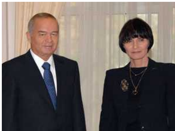
Ислам Каримов и Мишлин Кальми-Ре

Санкции, применявшиеся в течение четырех лет, заключались в запрете на въезд в страны ЕС нескольких высокопоставленных узбекских чиновников, запрете на экспорт в эту страну оружия, а также в ряде экономических ограничений, которые Узбекистан перенес легко, так как страны СНГ и часть европейские государств их просто не соблюдали. К примеру, Германия, основной разработчик стратегии ЕС в отношении Центральной Азии, с самого начала выступала против санкций, говоря об их экономической нецелесообразности.