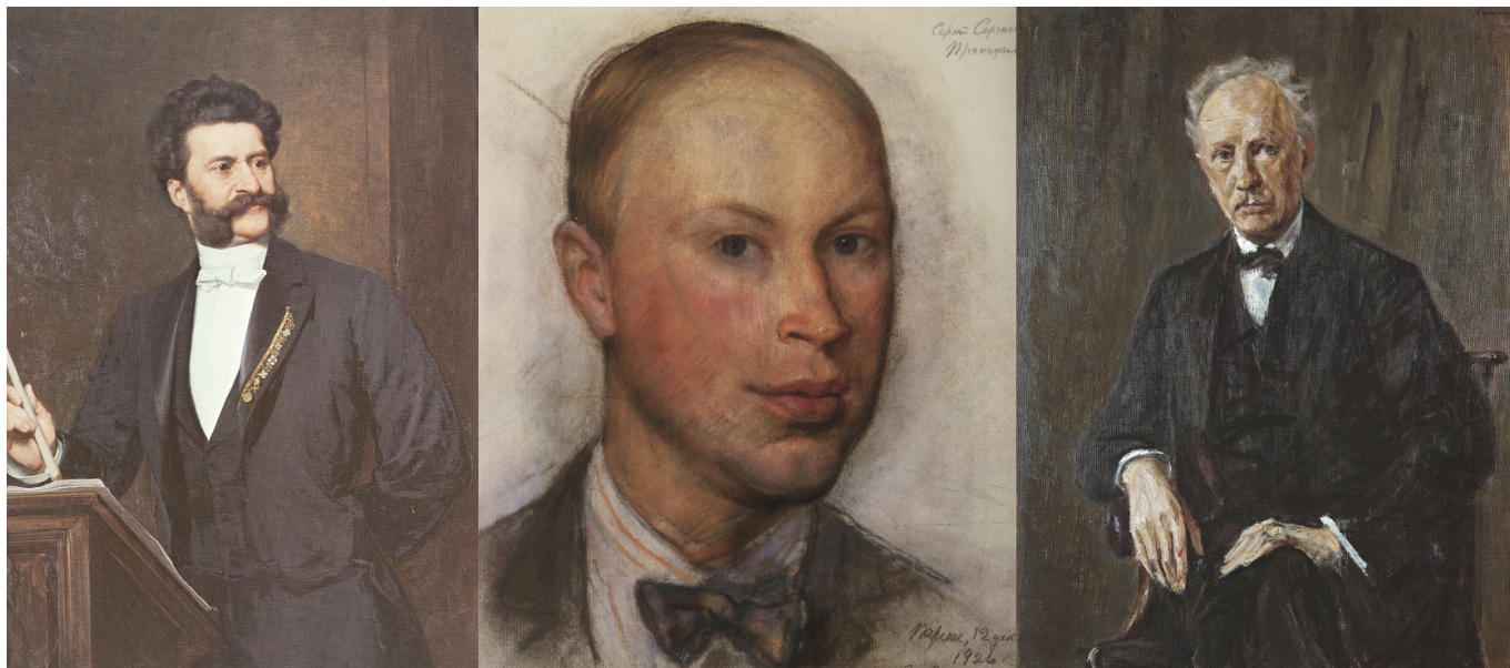
Портрет Иоганна Штрауса неизвестного автора; портрет С. С. Прокофьева Зинаиды Серебряковой, 1926 г.; портрет Рихарда Штрауса Макса Либермана, 1918 г.

Надо сказать, что программа новогодних концертов Оркестра Романдской Швейцарии составлена так, как может быть составлена только программа новогодних концертов. Где это видано, чтобы концерт открывался бисовым номером?! Но в этом и прелесть – при первых же звуках An der schönen blauen Donau («На прекрасном голубом Дунае») Иоганна Штрауса-сына, традиционно исполняемого на бис в Новогоднем концерте Венского филармонического оркестра, который проводится 1 января в Золотом зале здания Венского музыкального общества, просто невозможно не поддаться праздничному настроению!