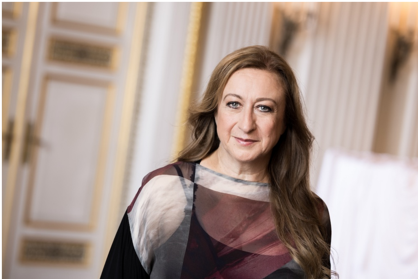
Симона Янг

Премьера оперы «Кавалер розы», две Вальсовые сюиты из которой завершат программу концертов ОРШ, состоялась в 1911 году также в Дрездене. И также вызвала бурные дебаты: композитора упрекали во всех смертных грехах - в стилистической эклектике, безвкусице и даже «бегстве от современности». Но публика вновь заняла иную позицию, и премьера запомнилась современникам композитора как «последнее беззаботное театральное торжество Европы перед войной». Лейтмотивом всей оперы проходит вальс, объединяющий все события и доносящий до нас дух старой Европы на пороге Первой мировой войны.