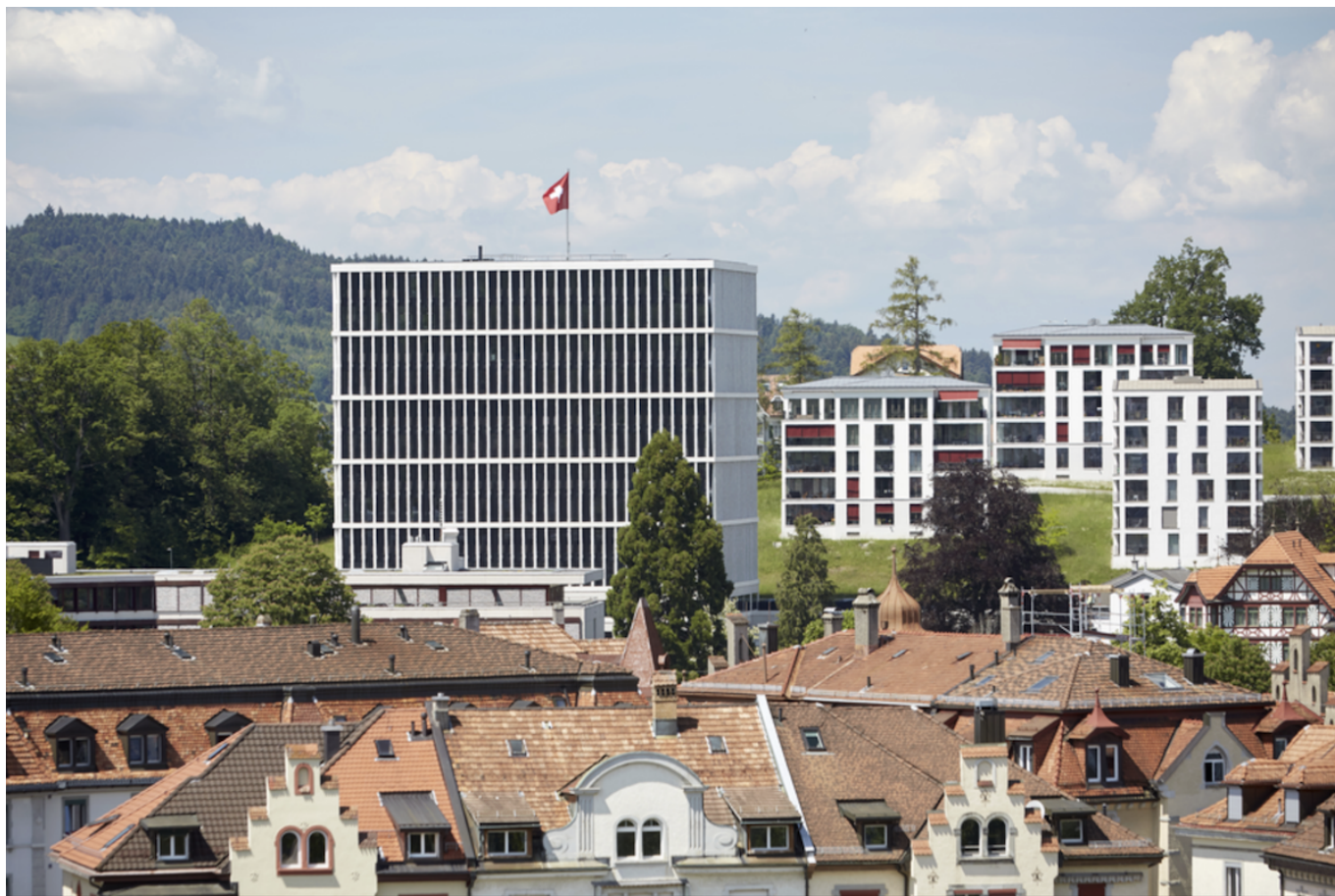
Здание федерального административного суда в Санкт-Галлене

Auteur: Заррина Салимова, Санкт-Галлен , 16.10.2025.